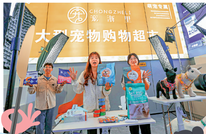
▲內地互聯網平台大數據「殺熟」亂象多發，近日中央網信辦等四部門重拳整治。圖為11月11日，浙江溫州主播在直播帶貨。