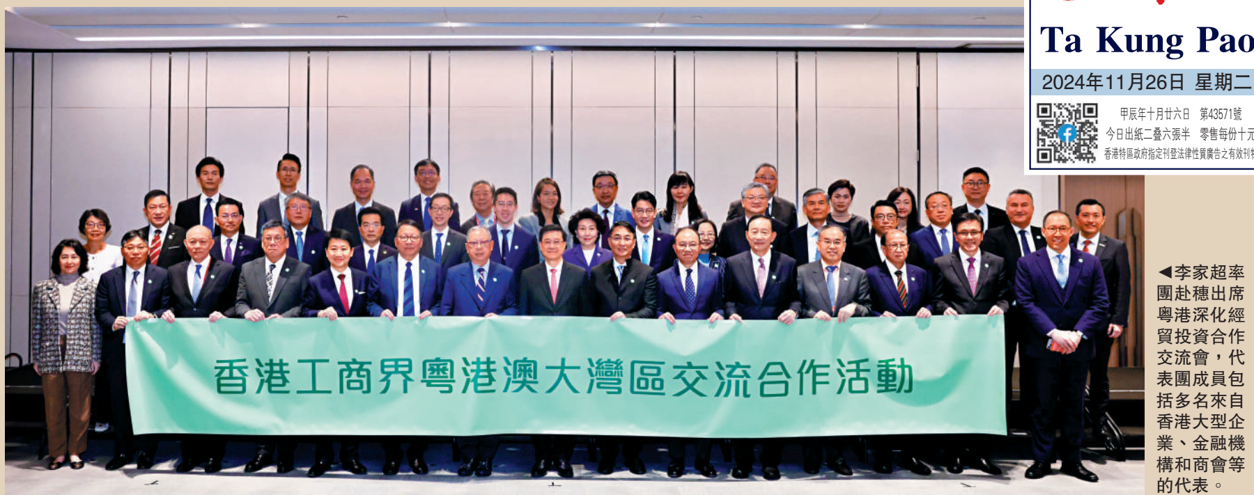
▲李家超率團赴穗出席粵港深化經貿投資合作交流會，代表團成員包括多名來自香港大型企業、金融機構和商會等的代表。