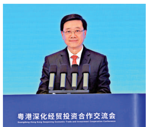
▲李家超表示，粵港在不同領域開展全方位緊密合作，取得豐碩成果。

【大公報訊】香港特區行政長官李家超在致辭中表示，建設粵港澳大灣區是習近平主席親自謀劃、親自部署、親自推動的重大國家戰略。如今的大灣區，已經成為中國開放程度最高、經濟活力最強的區域之一，為全球投資者帶來了無限機遇。香港與廣東地域相鄰、同根同源、唇齒相依、往來密切，近年來兩地秉承互利共贏原則，聚焦將粵港澳大灣區打造成為新發展格局的戰略支點、高質量發展的示範地、中國式現代化的引領地這個重點，在不同領域開展全方位緊密合作並取得豐碩成果。在「一國兩制」框架下，香港具有「背靠祖國、聯通世界」的獨特優勢，將積極融入國家發展大局，全力打造國際金融、航運和貿易中心，積極發展創新科技、文化藝術等新興產業，繼續推動香港與大灣區城市強化基礎設施互聯互通、產業協同發展，實現更高水平的共贏發展。