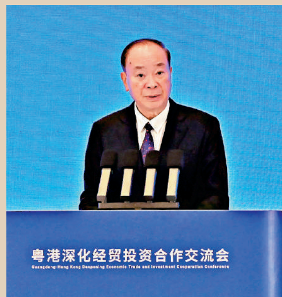
▲黃坤明表示，希望香港企業堅定信心、抓住機遇，深耕大灣區，共同成就夢想。