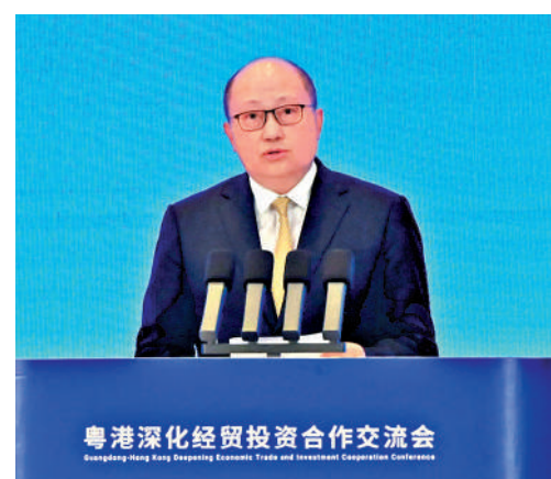
▲鄭雁雄表示，制度創新的香港特區煥發出新風蕩漾的獨特魅力，大有可為。

【大公報訊】中央政府駐港聯絡辦主任鄭雁雄在致辭中表示，中央對粵港澳大灣區建設的高度重視和對粵港澳的關心關愛，為三地高質量共建大灣區提供了清晰指引、指明了前進方向。在習近平總書記、黨中央堅強領導下，香港經濟社會發展出現可喜變化，政治生態發生深刻變化，飽經磨難的香港終於有了「中國香港」的樣子。制度創新的特區煥發出新風蕩漾的獨特魅力，進入大有可為、前景廣闊的全新发展階段。