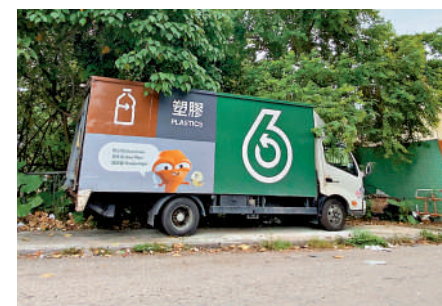
▲回收工場負責人表示，會按市價收購綠在區區送到工場的回收物。