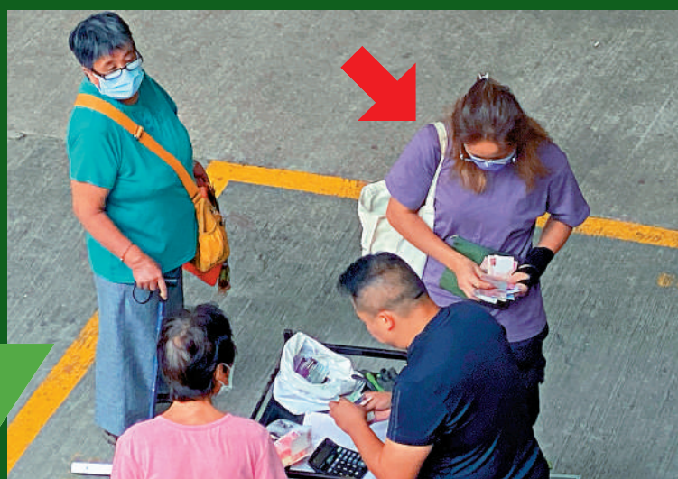
▲紫衣女子從回收商手上接過約數千元現金，即場點算。