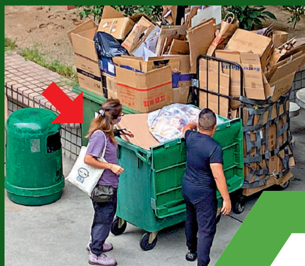
▲大公報記者日前直擊，有兩人把綠在區區門外裝滿廢紙的高身籠車及大型垃圾桶，推到屋邨內的空地，交予回收商；疑為綠在區區職員的紫衣女子與回收站負責人點算廢品。