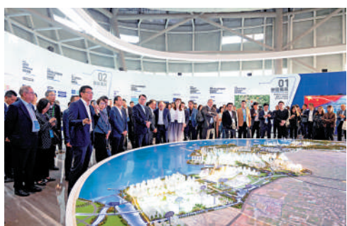
▲香港特區政府及工商界高層代表團走訪東莞濱海灣新區展示廳。

外資來源地，超過8000家港資企業在東莞扎根發展，全市實際吸收港資超487億美元，佔全市外資的比重接近六成。香港也是東莞的第一大出口市場，去年莞港貿易總額達到1690億元人民幣。在粵港澳大灣