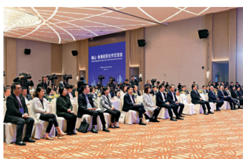
▲今次特區與工商界代表團由約80名成員組成，包括超過60名來自香港大型企業、金融機構和商會等的代表。

推進綠色經濟發展。唐屹峰表示，未來佛山將持續深化兩地的經貿合作，充分依託香港「超級聯繫人」的優勢，在更大範圍、更專業領域引進來走出去，推動兩地的創新鏈、產業鏈、資金鏈、人才鏈深度融合，實現互利互惠，合作共贏。