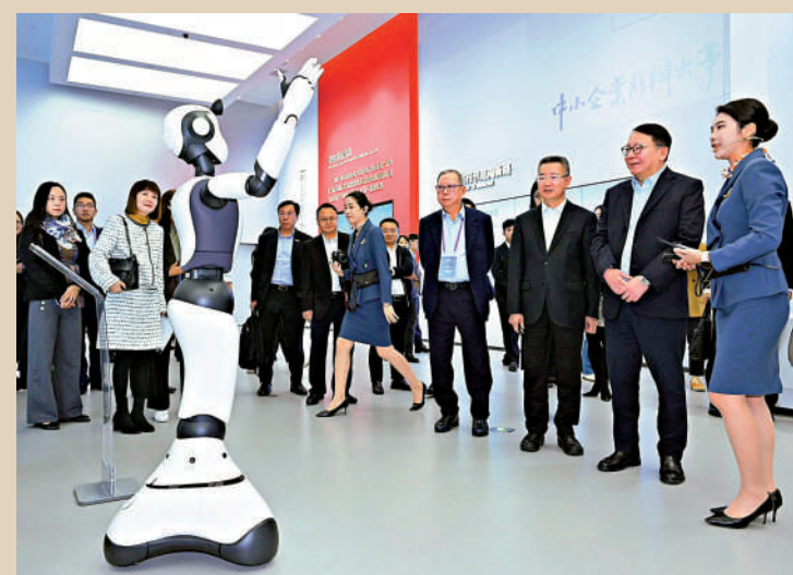
▲特區代表團一行參觀了廣州開發區規劃展示館、東莞濱海灣新區展示廳，以及一間位於東莞的智能製造中心，了解當地的規劃和產業優勢。

香港貿易發展局主席林建岳表示，北部都會區的建設是香港工商界關注的熱點話題，他會將這次走訪的經驗帶回香港，與北都的開發建設者互相交流。「現在大家對建設北都的意願都非常濃厚。」他指出，今次走訪多座城市，亦希望可以帶動更多香港企業和內地企業一起併船出海，尋求新的機會。林建岳認為，粵港兩地企業在科技、金融等領域有廣闊的合作空間。香港作為國際金融中心可以幫助灣區內地企業發債、上市、融資等。