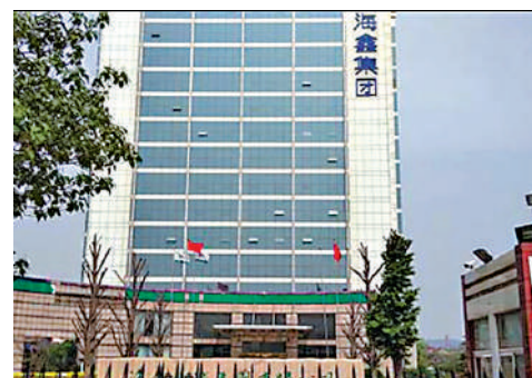
▲海鑫集團曾是山西省第二大鋼鐵企業。