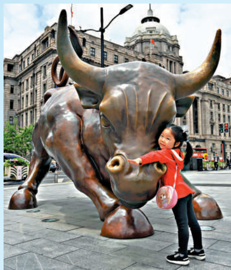
▲中國富豪家族財富傳承開始面臨高峰。