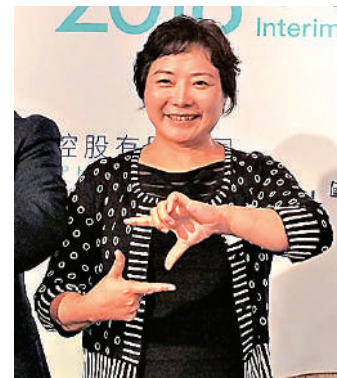
▲吳亞軍提前安排家族信託，實現龍湖集團平穩過渡。