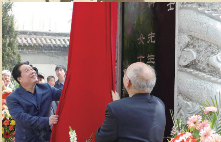
▲陝西省西安市原副市長朱智生（左）、財政部原部長項懷誠（右）為王銘軒紀念碑揭幕。

在用餐期間，毛主席接見了西安食堂幾位職工代表，親切地對他們說：「你們要好好為人民服務。」彭老總對毛主席特別介紹了王