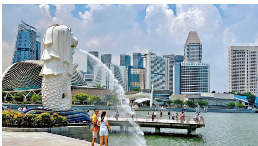
▲新加坡家族辦公室快速發展，但監管方面較嚴格。