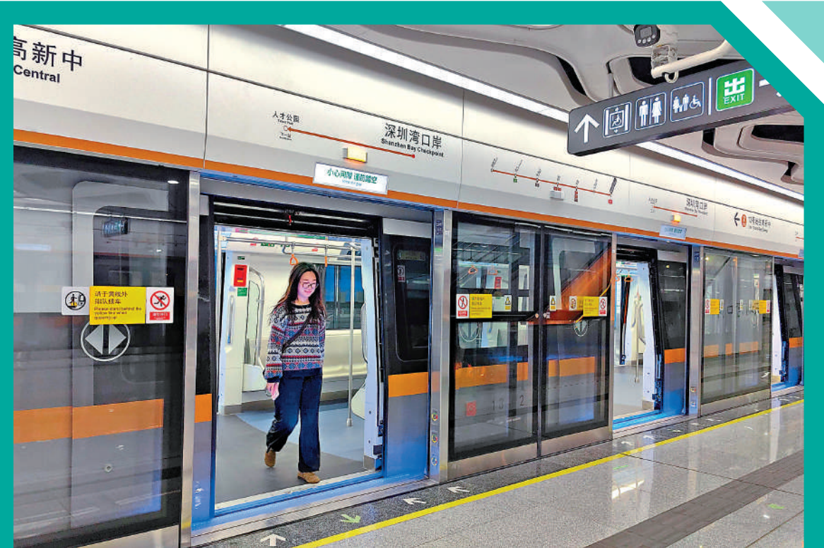
▲13號線深圳灣口岸站站台，乘客正在走出車廂。列車以亮橙色為主色調，時尚麗麗。