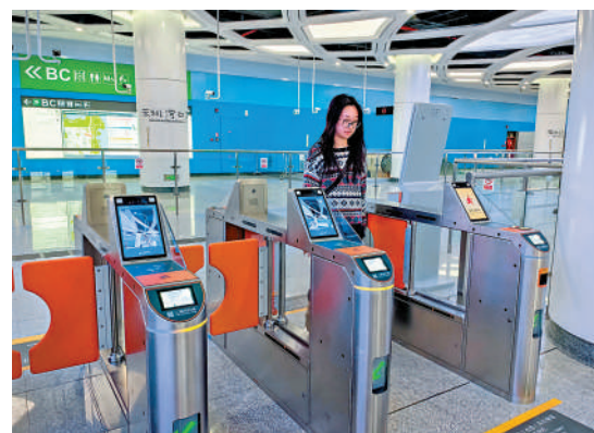
▲13號線深圳灣口岸站應設有開放式智能客服中心。圖為乘客正在進站。

車廂內採用LED照明，配備自動感光功能，既節能又可提升舒適感。採用加厚中空側窗、加厚隔音隔熱棉、一體式側護板貫通道、全鋪式複合木質地板，顯著提高車輛隔音降噪性能，優化乘客的乘車體驗。