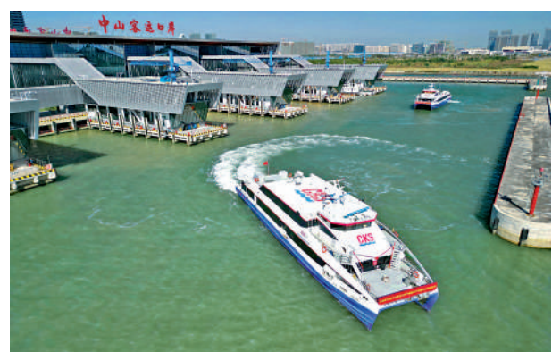
▲新中山客運口岸啟航，65分鐘抵達香港尖沙咀中港城。