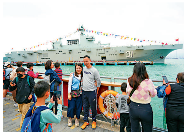
▲中國人民解放軍海軍海南艦和長沙艦編隊日前抵達香港進行訪問，吸引眾多市民、遊客前往參觀。圖為市民遊客在香港西環招商局碼頭參觀拍攝停泊於此的海南艦。

不少登上海南艦和長沙艦參觀的市民表示，對人民海軍的實力感到自豪，深切體會到國家的強大。有許多學生參觀後在留言板留言：「我愛祖國」「為中國驕傲」「難忘！加油」等字句。有專家分析，艦艇到訪港，向港澳同胞展示新時代中國國防和軍隊建設的成就，有助提升民族自豪感，增強愛國心，並讓外界看到中國軍隊發展建設成果和海軍艦艇編隊官兵的精神面貌。