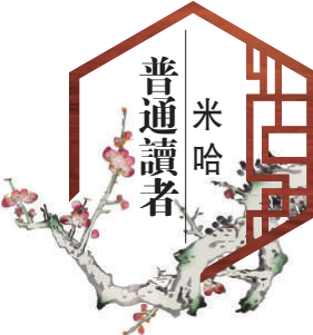
米哈普通讀者 逢周一、五見報