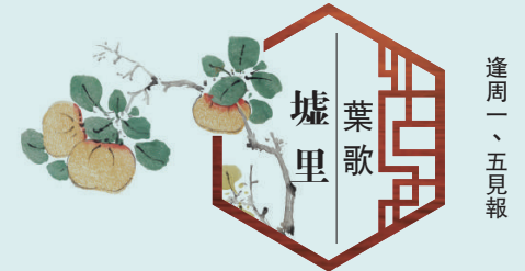
葉歌墟里 逢周一、五見報