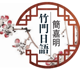
簡嘉明竹門日語 逢周四、五見報