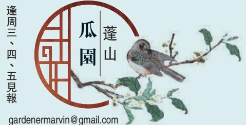
蓬山瓜圃 逢周三、四、五見報