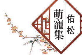
佑松萌寵集 逢周五見報