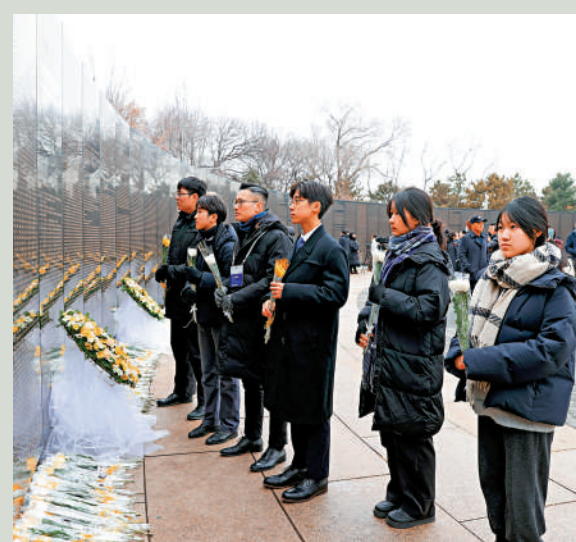
▲香港培僑中學師生在瀋陽抗美援朝烈士陵園內的英名牆前祭奠憑弔，並獻上鮮花。