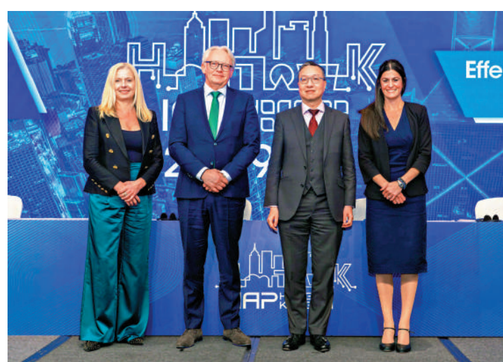
律政司長林定國日前出席在港舉行的國際檢察官聯合會亞太會議，與各地法律精英交流。

林定國指出，根據《2024年法治指數》，香港在東亞和太平洋地區排名第6，全球排名第23。在「廉潔」和「秩序和安全」方面，更分別位列全球第10和第9，這些成就反映了香港公平有效的檢控服務。