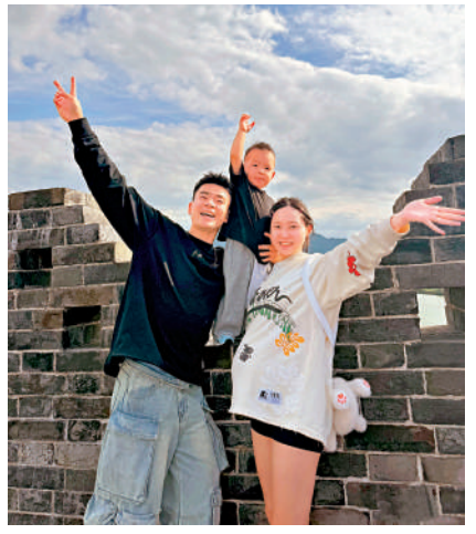
▲鄭思維（左）表示退出國際賽後，將有更多時間陪伴家人。

祝福鄭思維開啟新的篇章。難說再見，我們杭州見。」 作為巴黎奧運會冠軍，「雅思組合」已經獲得了2024年世界羽聯杭州總決賽的參賽資格，這將是他們在國際賽場的告別之戰。總決賽將於12月11日至15日在杭州奧體中心體育館舉行。