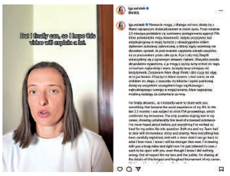
▲絲韋迪在社交平台拍片作回應，表示很高興可重返賽場。

迪已於11月27日承認違反了《世界反興奮劑條例》，並接受禁賽處罰。事件調查期間，她在9月12日至10月4日被禁賽，當時並未向外公布具體原因。