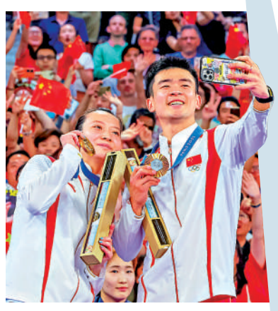
▲「雅思組合」在巴黎奧運會奪得混雙金牌。 ▲今屆年終總決賽將於12月11日在杭州展開。