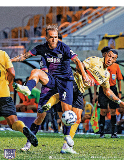
▲理文（黃衫）與傑志（藍衫）在港超首循環對陣1：1平手，未分高下。

全取三分後攀升至聯賽榜第四位，賽後主教練卡度素讚揚麾下球員在該仗的表現，並期望於下仗高級組銀牌賽繼續乘勝追擊，他指出：一眾戰將在上半場已取得五個入球，表現得很好，並喜見他們在場上的鬥志。 同時，教練團認為對手理文近期的表現相當不俗，球隊今仗將會受到嚴峻考驗。 今場門票收120元正，特惠票收50元正。