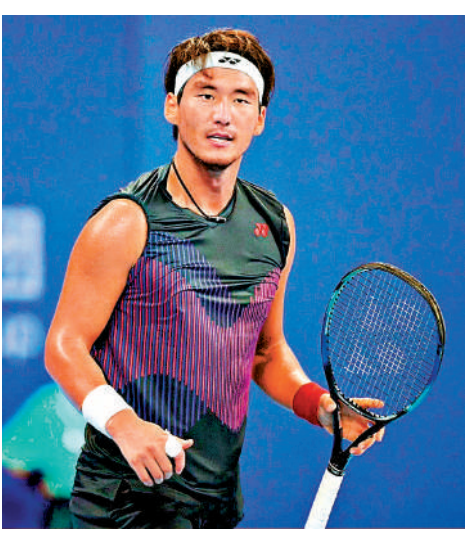
▲布雲朝克特對出戰香港公開賽充滿期待。

【大公報訊】內地網壇超新星布雲朝克特於29日已確認加入「中銀香港網球公開賽2025」參賽名單，該名22歲球手將在這項ATP揭幕戰中，與衛冕冠軍盧比利夫、左手天才球手商竣程以及中國香港首席球手黃澤林，於12月29日至2025年1月5日在維多利亞公園網球主場測試季初狀態。 布雲朝克特表示：「我很期待在香港公開賽展開2025年的賽季。賽事將衡量我在年終休賽期後的比賽狀態的重要指標，我在2024年季末的表現非常出色，我希望在未來幾個月能夠繼續保持這一勢頭。香港公開賽自去年首度舉辦後，我聽過很多有關這個賽事有多精彩，我迫不及待地想來港體驗一切。」