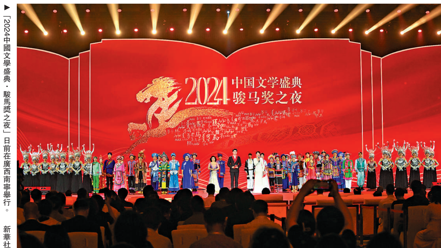
「2024中國文學盛典·駿馬獎之夜」日前在廣西南寧舉行。