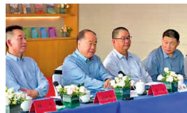
▲莫言（左二）等作家參加「《人民文學》，人民閱卷」座談會。

「我們如何以優秀的文學『答卷』回答時代『問卷』？主要看文學作品。文學作品好不好？『閱卷人』是人民，『驗收員』是人民、讀者。」中國作協書記處書記施戰軍表示，2022年，《人民文學》雜誌社啟動「人民閱卷」行動，逐步打造出「編、創、讀、評、推」的「人民閱卷」模式。