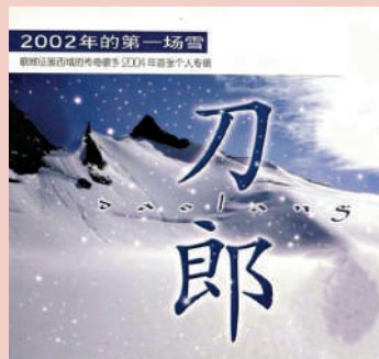
• 《2002年的第一場雪》 • 2004年發行