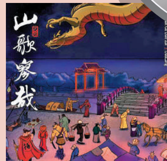
• 《山歌響起的地方》 • 2023年發行