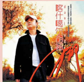
• 《喀什噶爾胡楊》 • 2004年發行