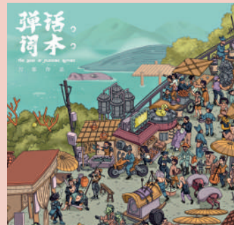
• 《彈詞話本》 • 2020年發行