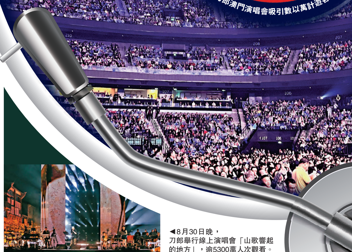
◀ 8月30日晚，刀郎舉行線上演唱會「山歌響起的地方」，逾5300萬人次觀看。