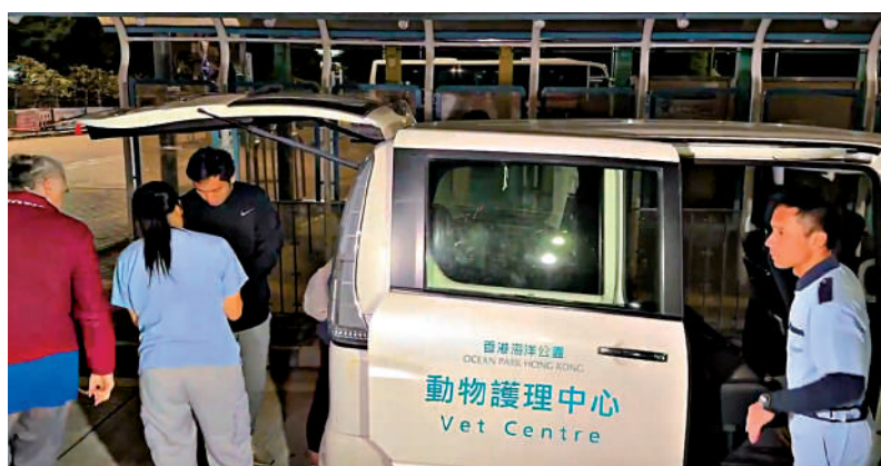
海洋公園動物護理中心人員深夜緊急到場搶救擱淺鯨魚。