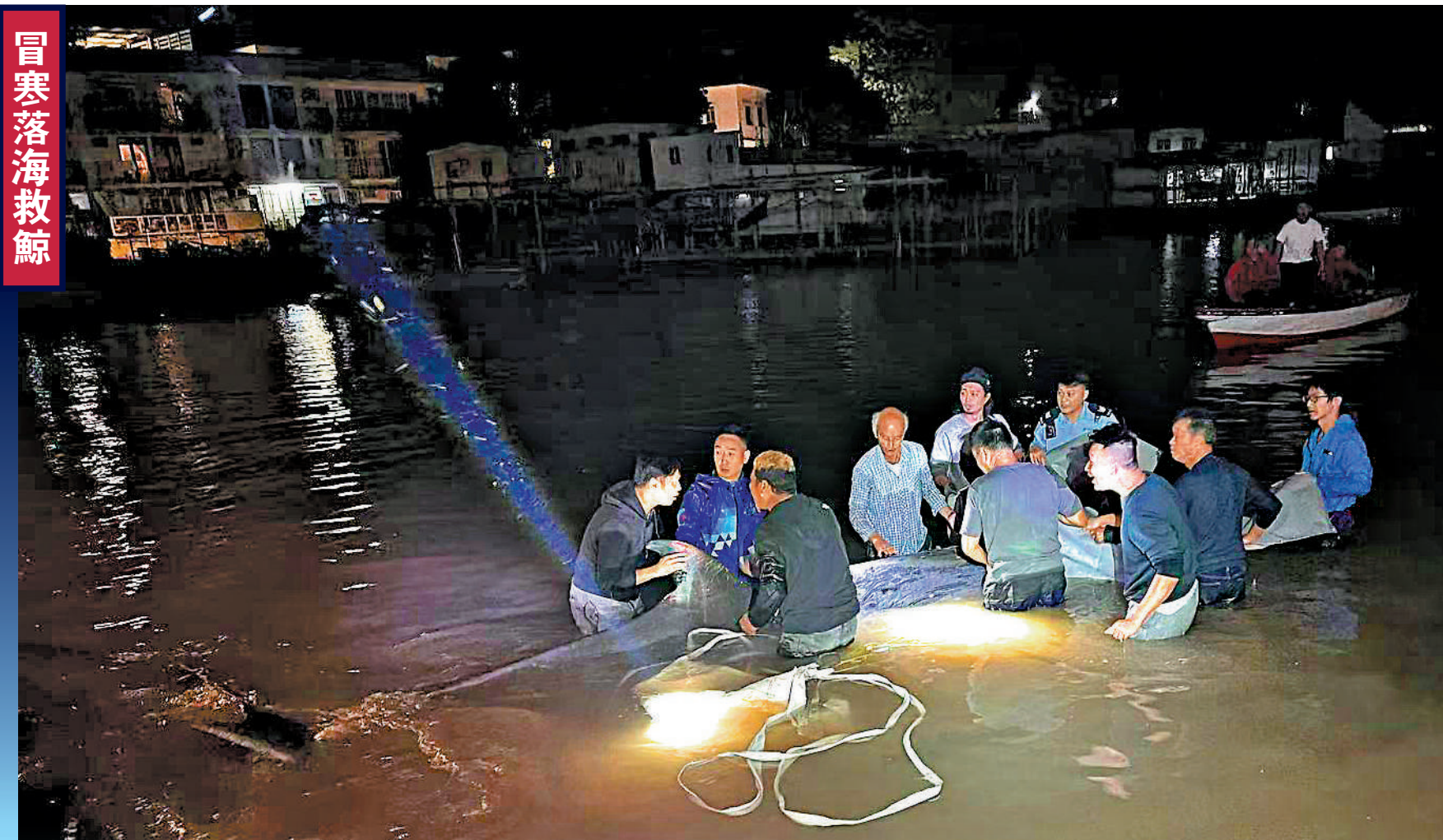
大澳昨晚發現有鯨魚擱淺，多名市民落水合力拯救。