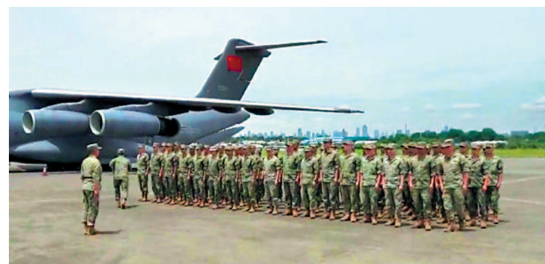
▲當地時間11月30日，中方參演部隊乘運-20抵印尼。圖為中方參演部隊在哈利姆機場接受歡迎儀式。

【大公報訊】據中新社報道：當地時間11月30日，「和平神鷹-2024」聯合演習中方參演部隊順利抵達印度尼西亞雅加達。據悉，中方參演部隊採取空中投送方式，於當天清晨搭乘運-20運輸機從廣東某軍用機場起飛，中午降落在印尼國民軍空軍哈利姆機場，印尼方為中方官兵舉行了歡迎儀式。在哈利姆機場完成卸載作業後，中方參演部隊分頭機動至各自演習地域，與印尼方參演兵力協同展開適應性訓練。