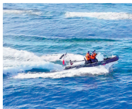
▲中國海警派出快艇參與執法巡查。

近來，菲律賓挑釁不斷加劇。11月8日，菲律賓正式出台「海洋區域法」和「群島海道法」，將中國黃岩島和南沙群島大部分島礁及相關海域非法納入菲方海洋區域。不僅如此，綜合外媒報道，菲國防部似乎正為進一步挑釁行為做準備，計劃斥資至少330億美元購買包括先進戰鬥機在內的新武器。