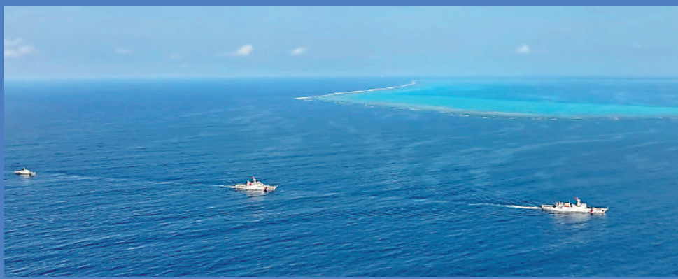
▲中國海警船編隊執法巡查中國黃岩島領海。 ▶11月30日，中國海警位中國黃岩島領海及周邊區域執法巡查。圖為參與執法巡查的海警3304艦。