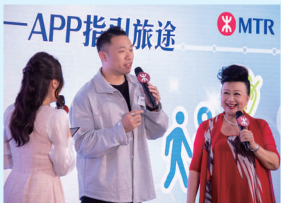
▲「關愛共乘」宣傳大使薛家燕及巴黎殘疾人奧運會銀牌得主陳浩源分享如何使用升級版「關愛共乘」App輕鬆規劃行程。