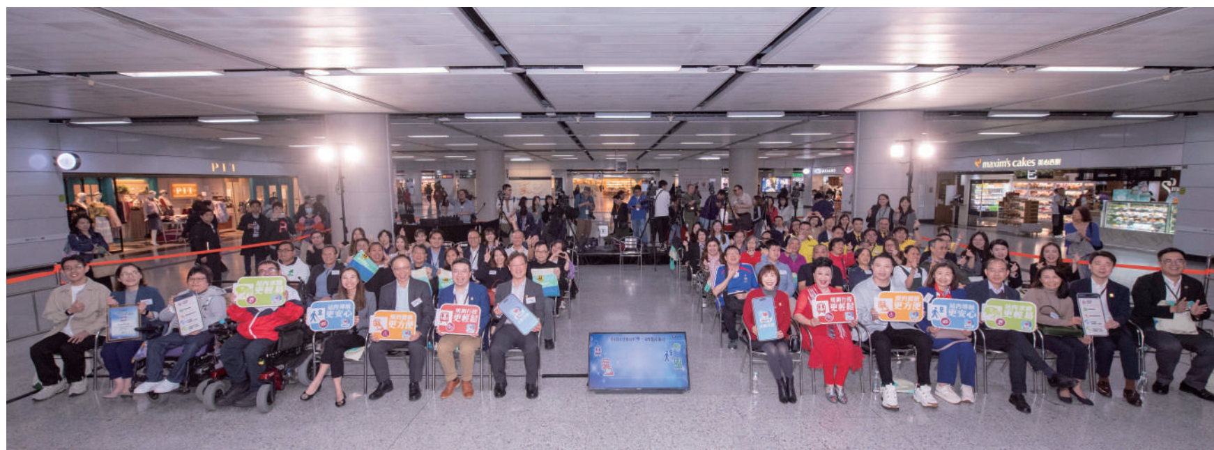
▲升級版「關愛共乘」App啓動禮邀得多個長者及殘疾人士團體出席，支持港鐵善用科技，推動共融無障礙的乘車環境。

為照顧長者的出行需要，升級版「關愛共乘」App的界面設計特別提供加大字體和圖標，並支援語音輸入功能，讓視力或手部動作不方便的用戶也能輕鬆使用。應用程式還能自動根據用戶的常用站點設置行程，並推薦轉車次數最少的路線，幫助長者更輕鬆地前往目的地。此外，乘客亦可以透過該應用程式掌握車站升降機的實時服務狀態，及針對目的地的「快捷出站」資訊，行程更輕鬆順暢，進一步提升整體乘車體驗。除了長者群體，港鐵亦關注輪椅人士的特殊需求，升級版App新增的「輪椅活動摺板預約」功能，讓輪椅使用者可以提前輸入行程資料，預約摺板服務。車站職員將根據預約資訊提前準備好摺板，並在乘客到達指定月台後提供協助，讓輪椅使用者能夠更輕鬆地進出車廂。這項