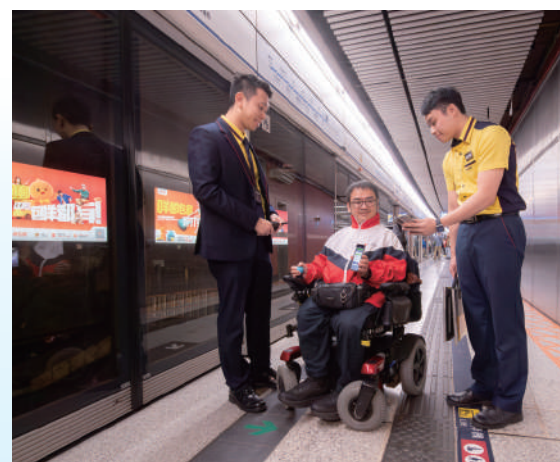
▲▼輪椅人士可使用新增的「輪椅活動摺板預約」功能，節省等候時間，安排行程更有預算。

除了升級「關愛共乘」App，港鐵公司多年來亦不斷完善無障礙設施，為具不同需要的乘客提供更貼心的服務。目前，所有港鐵車站均設置至少一部闊閘機，方便輪椅、嬰兒車及攜帶大型行李的乘客進出車站；同時，一些車站亦增設了無障礙洗手間、電動輪椅充電位、關門提示閃燈等，為有需要的乘客提供安全、舒適的乘車環境。這些設施的全面升級，與「關愛共乘」App的功能相輔相成，共同構建了一個更加便利且包容的出行環境。港鐵公司一直積極透過科技，提升乘客的出行體驗。透過升級「關愛共乘」App，港鐵進一步實踐以客為本的服務理念，不僅讓長者及有需要人士的出行更加輕鬆便捷，也為推動社會共融和可持續發展樹立了新典範。未來，港鐵將繼續聆聽乘客需求，結合科技創新與人性化設計，不斷完善配套設施，讓每一位乘客都能感受到無障礙出行的便利與溫暖，攜手邁向美好的未來。（特刊）