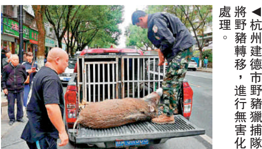
▲杭州建德市野豬捕獲隊將野豬轉移，進行野豬無害化處理。

除了獵捕，全國多地都在探索行之有效的方法。深圳開通首條野生動物專用「生態廊道」，連接城市周邊的自然保護區，幫助野豬在不同棲息地之間移動，使其移動路徑不與城市居民生產生活產生交集。針對城市區域，建立野生動物防護系統，掌握城市周邊主要野豬集群的動向，對其可能的侵襲做出預判。