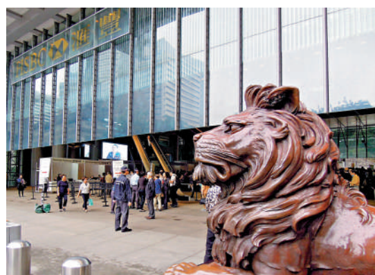
▲分析指今年「聖誕鐘買滙豐」的勝算提高，建議現價買入。