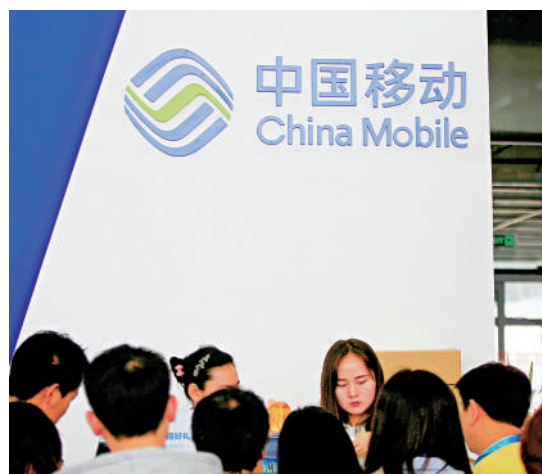
▲中移動息率高達7厘，屬進攻退可守。

港股缺乏方向，持續在19000至20000點區間上落。分析認為，市場觀望氣氛趨濃厚，一方面關注聯儲局月中會否再度減息，同時更聚焦下月華府換屆後的貿易政策。相對較波動的科網股，審慎的投資者可留意高股息的滙控（00005）及中移動（00941）。