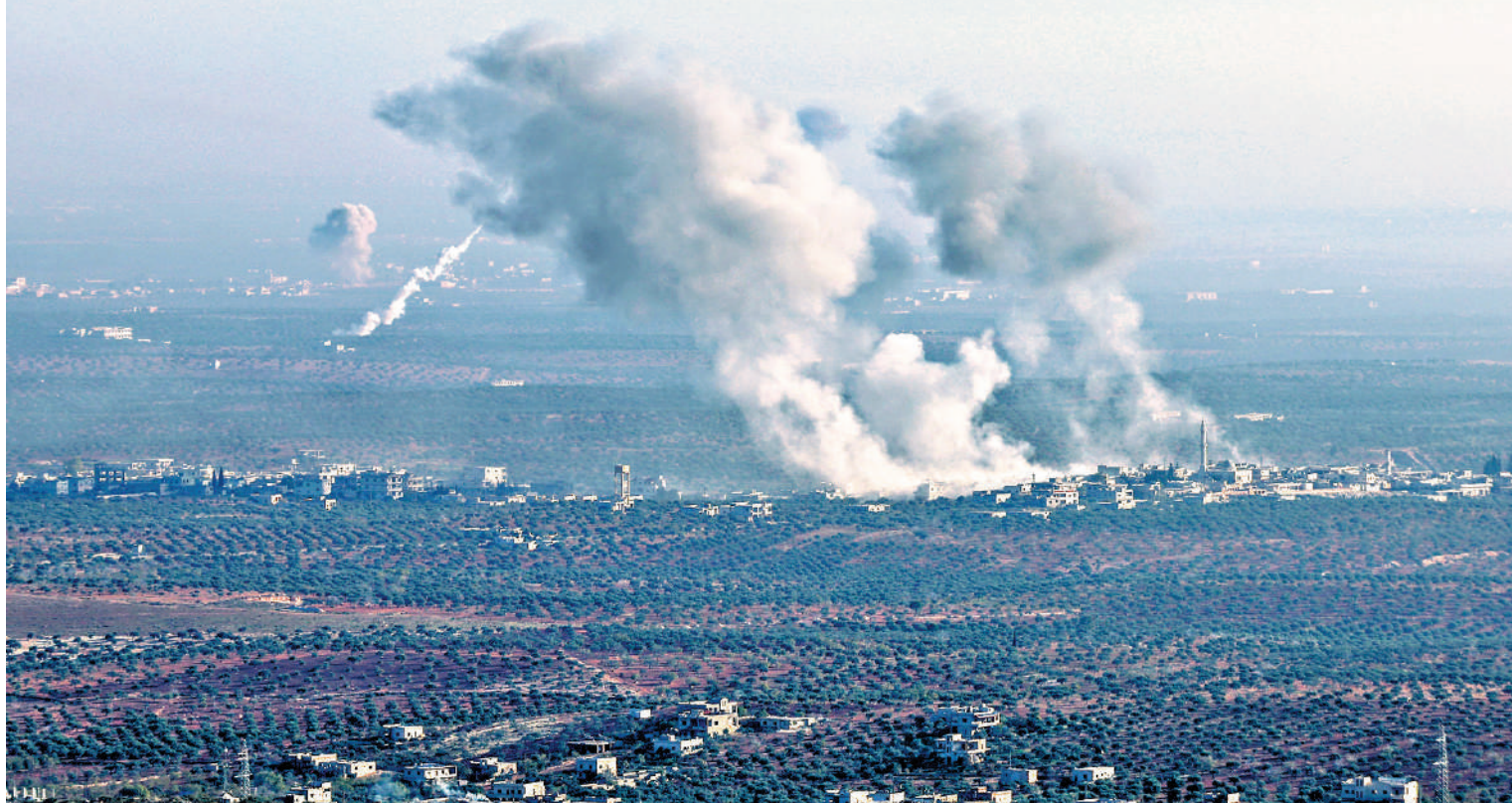
▲敘利亞政府軍和反對派武裝11月27日起在敘西北部交火。