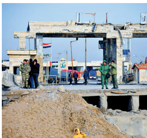
▲工作人員11月29日在黎敘邊境阿里達口岸附近修復因以軍空襲受損的道路。

【大公報訊】綜合《紐約時報》、半島電視台報導：以色列與黎巴嫩真主黨之間的停火協議生效後，以軍仍多次空襲黎境內目標，引發外界擔憂。11月30日，以軍空襲黎巴嫩與敘利亞交界處的一個目標，並聲稱這是真主黨走私武器的場所。黎媒稱，以軍還襲擊了黎南部村莊，造成多人傷亡。