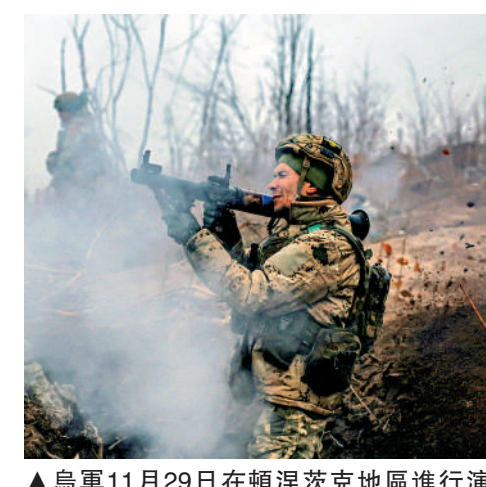
▲烏軍11月29日在頓涅茨克地區進行演習。

12月1日，新任歐洲理事會主席科斯塔與歐盟外交與安全政策高級代表卡拉斯上任首日就到訪烏克蘭首都基輔，以示對烏克蘭的支持。俄安全會議副主席梅德韋傑夫說，這表明歐盟領導層的首要任務是延長戰爭，而不是保障歐盟人民的福祉。俄總統普京1日簽署俄2025年聯邦預算及2026至2027年聯邦預算計劃的法案。相關文件顯示，俄2025年支出將超過41萬億盧布。據俄媒報導，俄國防開支預計為13.5萬億盧布，較2024年增加近30%。