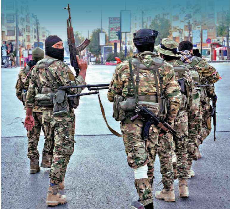
▲敘利亞反對派武裝分子11月30日在阿勒頗巡邏。