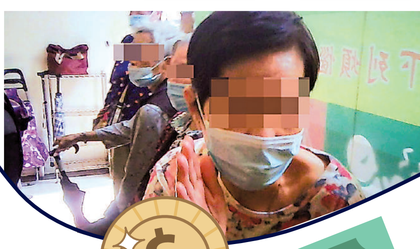
▲在觀塘店舖內，有長者疑「做媒」，大讚產品有效。