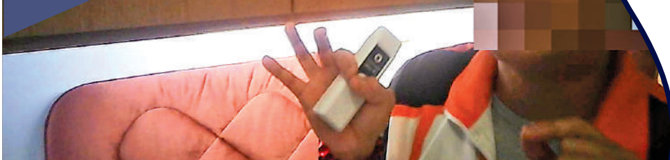
▲在旺角店舖，工作人員介紹產品時，多用「幫助改善」等字眼，暗示「儀器有效」。