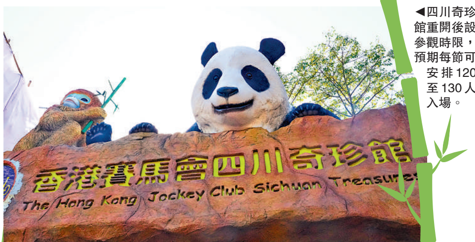
四川奇珍館重開後設參觀時限，預期每節可安排120至130人入場。

海洋公園本週六會舉行「大熊貓亮相儀式」，行政長官李家超將會出席，屆時會公布命名比賽和繪畫比賽結果。海洋公園現已增加園內的大熊貓布置，多處放置卡通大熊貓展板的，用大熊貓裝飾的聖誕樹，紀念品商店的窗戶亦已貼上大熊貓照片並售賣多款大熊貓產品，餐廳亦推出大熊貓造型的食品。