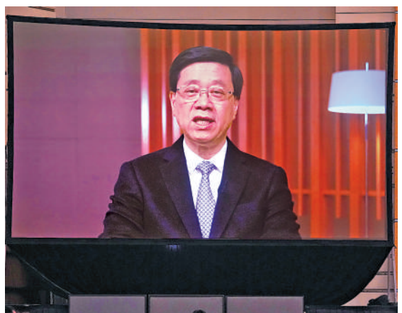
▲香港潮州商會第54屆會董就職典禮昨晚在香港會議展覽中心舉行，行政長官李家超（上圖）作視頻致辭。

【大公報訊】記者龔學鳴報導：香港潮州商會第54屆會董就職典禮昨晚在香港會議展覽中心舉行，高佩璇成為商會成立103年來首位女會長。行政長官李家超在視頻致辭中表示，當前香港正處於經濟轉型的關鍵時刻，不論是政府或社會各界都必須積極求變，改革創新，潮州人一向是香港工商界的中堅力量，相信今後將繼續以港為家、倚港興業，以實際行動推動香港經濟和社會更蓬勃發展。