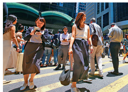
▲ 港股今年表現出眾，今年首11月MPF人均賺2.38萬元。

【大公報訊】強積金顧問公司GUM昨公布，強積金（MPF）上月回報0.14%，人均賺326元。港股今年表現出眾，今年首11月MPF人均賺2.38萬元，全年增幅有望雙位數。