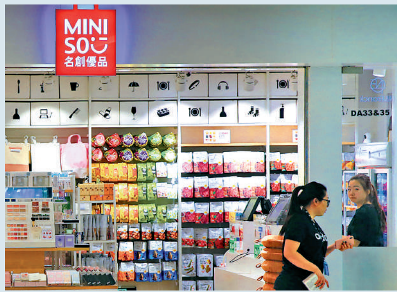
▲野村推薦包括名創優品等股份。