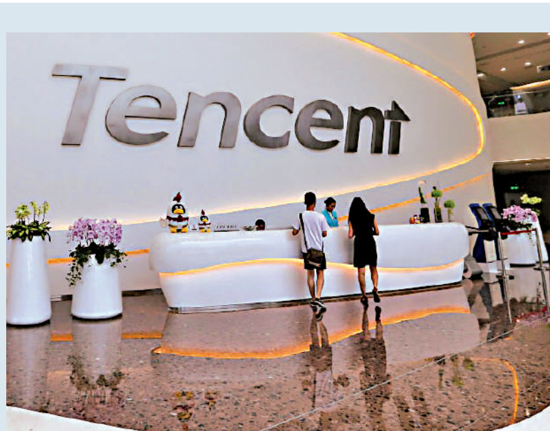
▲凱基建議買股不買市，推薦騰訊等股份。

整體大市方面，港股連升三日後回氣，恒指昨跌3點，收報19742點。商品股領跑藍籌股，中國神華（01088）股價升4.1%，收報34.05元。中石油（00857）股價升3.1%，收報5.81元。中國宏橋（01378）股價升2.8%，收報12.08元。