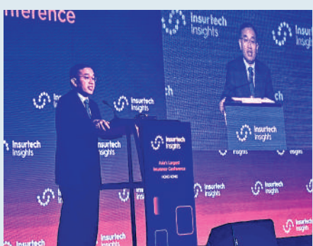
▲許正宇稱，特區政府加強粵港澳大灣區內保險市場的互通性。

他續說，特區政府正努力加強粵港澳大灣區內保險市場的互通性。具體措施包括：檢討今年早些時候推出的風險為本資本（RBC）制度，並檢討基礎投資的資本要求。此外，特區政府還繼續邀請內地和海外企業在香港設立保險子公司，並啟動在香港建立保單持有人保障計劃的立法準備工作。這些倡議旨在分散風險投資組合，鼓勵基礎投資，並加強保險行業的韌性。