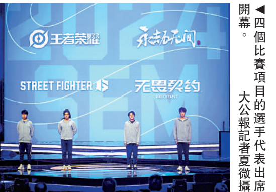
▲上海電競大師賽開幕。主辦方供圖

參賽陣容升級的同時，今年賽事舞台也進行了全新設計，騰出更多內場空間，提供更多觀賽位，吸引更多觀眾入場，近距離感受頂級電競選手的表演。售票一經開放，內場座位立刻成為爭奪的焦點，雙休日熱門場次內場票頃刻售罄。為了體現城市名片賽事的公益屬性，「上海體育」微信公眾號特別推出了觀賽福利活動。針對電競賽事觀眾的需求，賽場周邊增設了觀賽服務點。