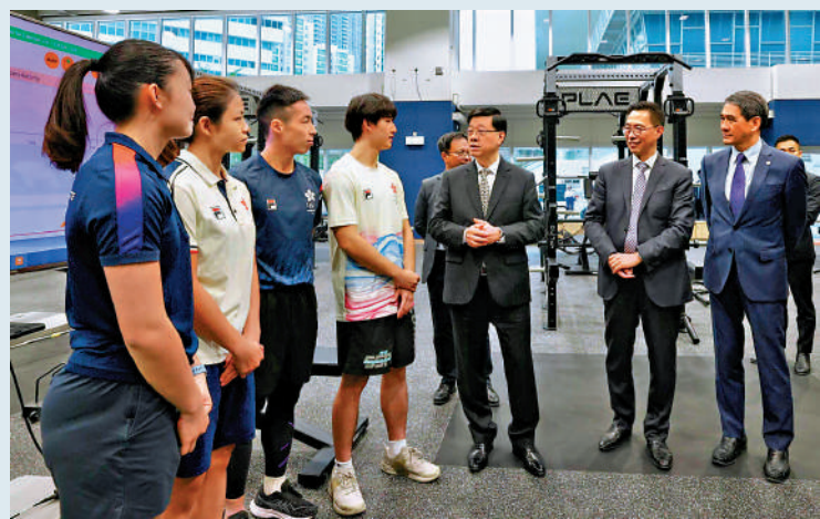
▲李家超(右三)與運動員交流。