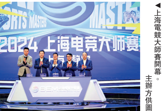
▲上海電競大師賽開幕。