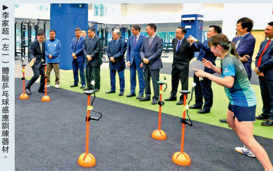
▶李家超(左一)體驗乒乓球感應訓練器材。

李家超期望隨着啟德體育園即將在明年首季啟用，以及明年底粵港澳三地共同承辦第15屆全國運動會及全國第12屆殘疾人運動會暨第9屆特殊奧林匹克運動會，香港的體育熱潮將會一浪接一浪。政府必定會把握這個機會，積極推進體育普及化、精英化、盛事化、專業化和產業化發展。