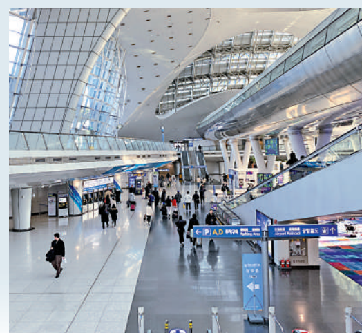
▲昨日首爾仁川國際機場旅客大減，人流稀疏。