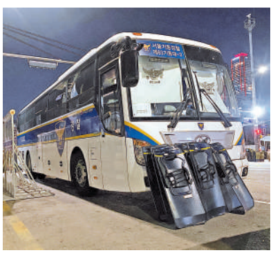
▲國會議事堂附近昨晚有警員及警車駐守。