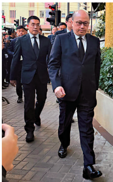
▲中央政府駐港聯絡辦主任鄭雁雄（前）到場弔唁。