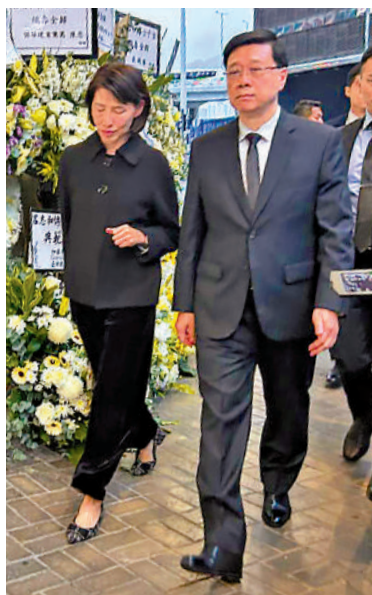
▲香港特區行政長官李家超（右）到場弔唁。