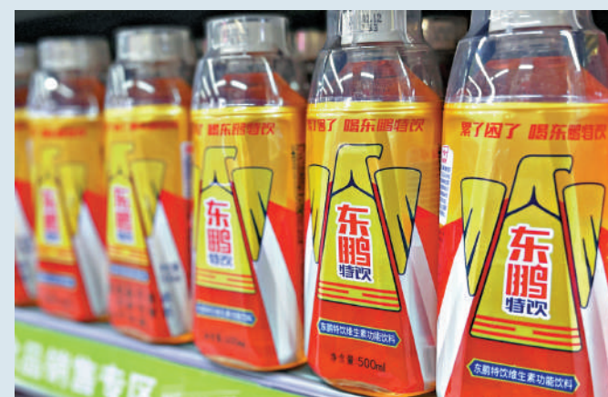
▲東鵬特飲是東鵬飲料最暢銷產品。