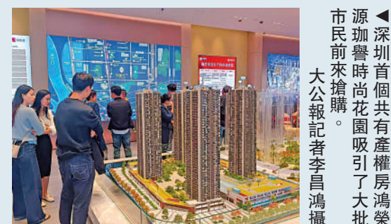
▲深圳首個共有產權房鴻榮源珈譽時尚花園吸引了大批市民前來搶購。

因為共有產權房是購房者與政府分別擁有50%的權益，從而降低了購房壓力和買房門檻，房價僅為市場的一半，這樣可以讓很多市民低成本上車，更早實現入住新家的夢想。