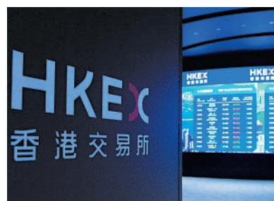
▲港交所推新措施，加快A股公司上市審批。

在合資格A股公司快速審批時間表下，若合資格A股上市公司提交完全符合規定的申請，證監會及聯交所分別只會發出一輪監管意見。在此情況下，兩家監管機構各自的監管評估將在不於30個營業日內完成（而非上述適用於「完全符合規定的申請」的不於40個營業日）。