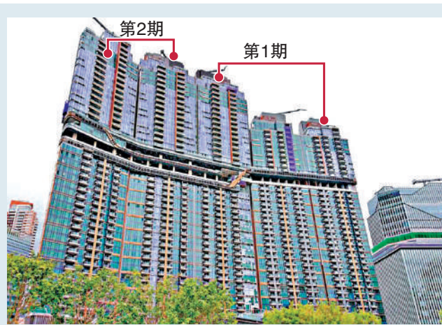
預售。天璽·天共分兩期，第2期上月獲批

該5個樓盤中，由信和置業（00083）等組財團投得的港鐵（00066）將軍澳日出康城第13期項目，所涉兩份預售書共提供2550個單位，是上月最