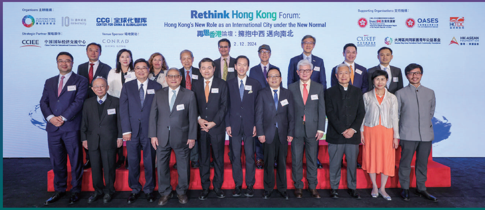
一眾講者、嘉賓、支持機構及策略夥伴代表於論壇合照。

團結香港基金與全球化智庫合辦的「再思香港論壇：擁抱中西 邁向南北」（論壇）於12月2日舉行。在國際大變局下，機遇與挑戰並存。香港作為「超級聯繫人」及「超級增值人」，在制度、環境、人才等方面，均具獨特優勢和地位，是次論壇目的是探討如何在複雜環境下作突破，繼續推動中外交流合作，並善用粵港澳大灣區（大灣區）、東盟、「一帶一路」沿線國家和地區等政策主張下，探索新機遇，論壇最終吸引超過六百名嘉賓參與。