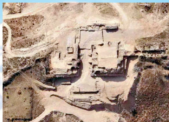
陝西神木石峁遺址。

在古國發展時期，西遼河流域的紅山文化開始衰落，而長江中下游地區的文明如良渚文化，與黃河中下游地區的文明如大汶口文化走上了發展道路。中原和北方地區，如陶寺文化、石峁文化等後來居上，開始新一輪的文明發展，進而形成了一個以中原為中心的歷史趨勢，奠定了中國歷史發展的基礎。