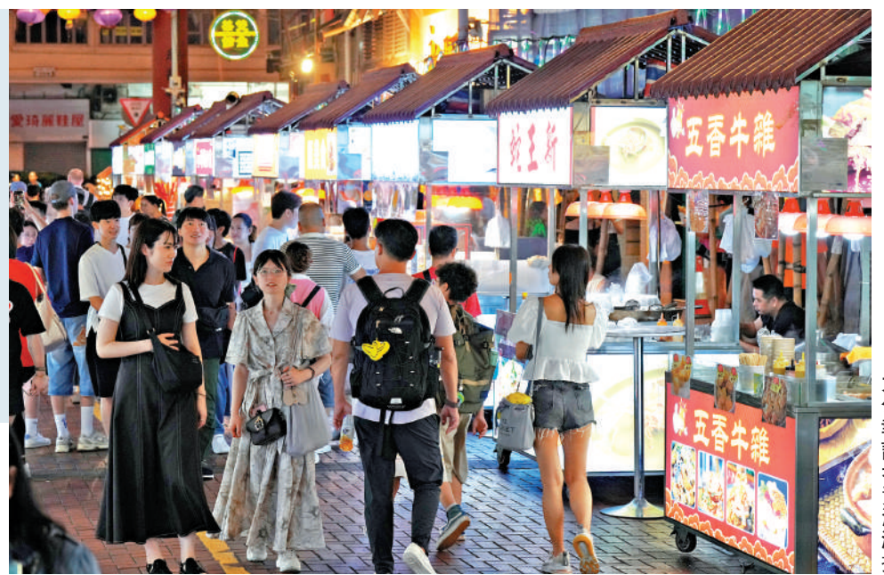
廟街夜市一度帶旺市況，商戶盼接棒營辦。

政府於去年9月開展「香港夜繽紛」活動，聯同社會各界舉辦一系列夜間活動，目標為市面營造熱鬧氣氛，令香港的晚上活起來、動起來。廟街夜市是夜繽紛活動之一，由旅發局、油麻地廟街販商會合作統籌營運，增設小食攤位、發光藝術裝置等打卡位，半年間吸引逾120萬人次到訪，旅發局於今年4月宣布，原定半年的營運期延長半年。據了解，旅發局將如期於本月退出營運，藝術裝置、小食攤車仔等硬件留給廟街。