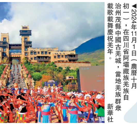
初一日，在四川省阿壩藏族羌族自治州茂縣中國古羌城，當地羌族群眾歡慶羌年。

據悉，鱗甲是世界上使用最廣泛的一種鎧甲，在古代各文明國度的軍隊中，都有鱗甲的出現。此次發現的鱗甲位於海昏侯劉賀墓西回廊北部的武器庫中，隨後被送到江西省文物考古研究院設在南昌漢代海昏侯遺址博物館內的考古實驗室進行研究。