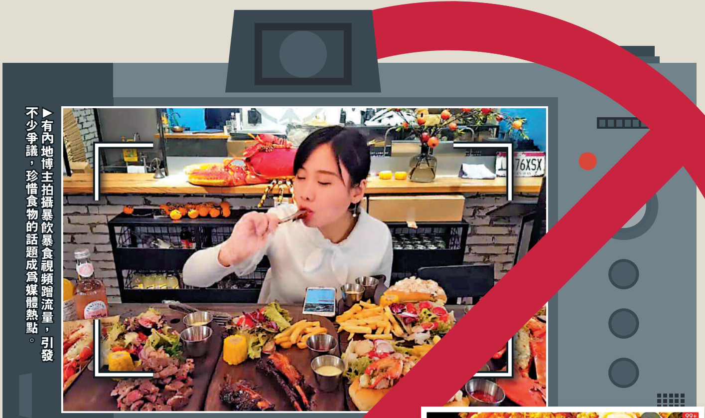
不少內地博主拍攝暴飲暴食視頻博取流量，引發不少爭議，珍惜糧食的話題成為媒體熱點。