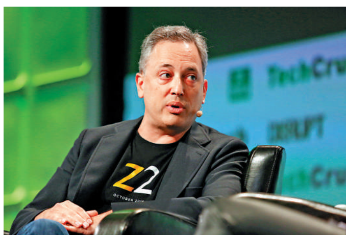
►電子支付平台PayPal前首席運營官薩克斯。

此外，這也是美國聯邦政府首次設有專門負責加密貨幣和AI政策的高級官員，進一步鞏固了外界對特朗普政府打算放鬆對AI科技、尤其是加密貨幣監管的預期。特朗普失言要讓美國成為「比特幣與加密貨幣的世界之都」。自11月5日特朗普在大選中勝選以來，比特幣價格累計升幅超過50%，12月4日一度升穿10萬美元。