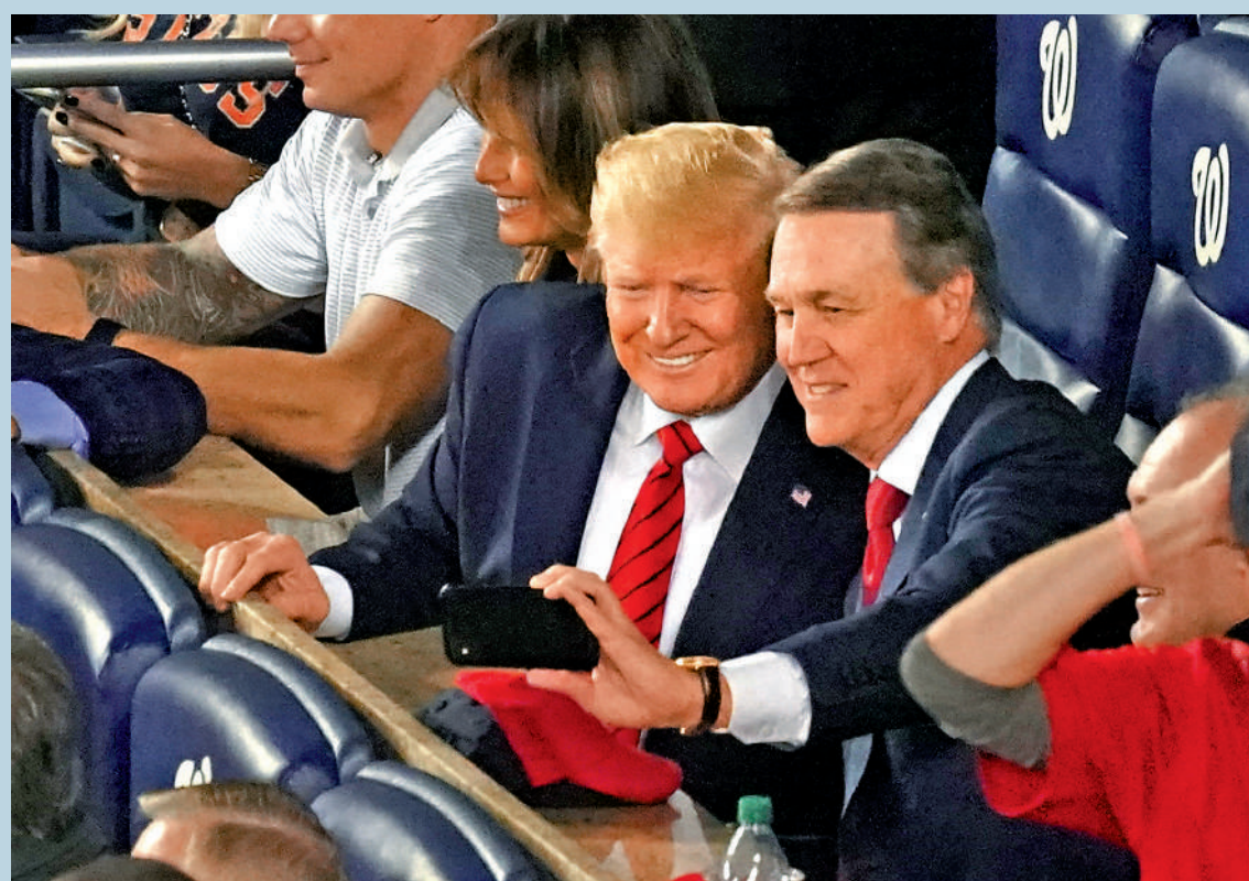
►2019年，特朗普(左)與珀杜一起觀看棒球比賽。