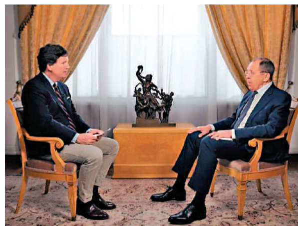
▲俄羅斯外長拉夫羅夫(右)接受美國記者卡爾森採訪。

使用美國遠程導彈打擊俄羅斯領土，這標誌着危險的升級。他強調，西方認為俄羅斯的紅線可以「一次又一次地移動」，是「一個非常嚴重的誤判」。