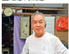
▲吳先生憂補償金無法負擔重開診所。