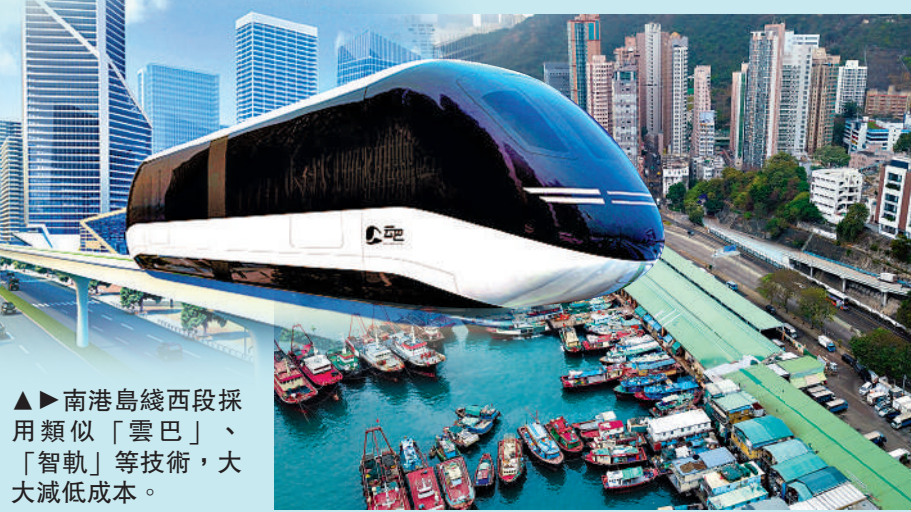
▲南港島綫西段採用類似「雲巴」、「智軌」等技術，大大減低成本。

【大公報訊】記者龔學鳴報導：新任的運輸及物流局局長陳美寶昨日出席立法會鐵路事宜小組委員會，交代鐵路項目最新進展。陳美寶指出，南港島綫西段以高架形式推展鐵路，可將成本壓低四成。未來亦會利用技術創新和政策創新思維，廣納內地、本港和海外新科技和技術，為鐵路項目提供重鐵以外的選擇，並盡量壓縮相關程序。