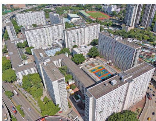
▲彩虹邨重建第一期的住戶，將遷往新美東邨，預計2028/29年入伙。 大公報記者逐初攝

預計2028/29年入伙。受第1期重建影響的長者住戶，如有需要，可申請邨內調遷往第2、3期的樓宇，將會獲酌情處理。第1期住戶如欲購買資助房屋，可於目標清空日期前，優先選購綠置居宏照第1期、第2期的單位（兩期總共4043個單位）。