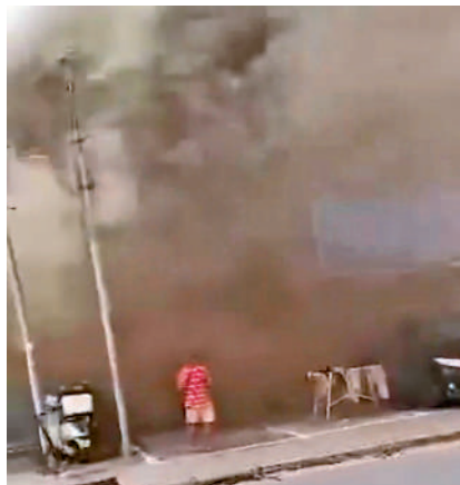
▲一名男子呆站在船廠外，被濃煙籠罩。

據了解，火警前一日起火現場附近的另一間船廠對開，一個放置在船廠外多年的車斗亦發生火警，車斗被燒至通頂，初步調查懷疑是有未熄的煙蒂點燃雜物導致火警。