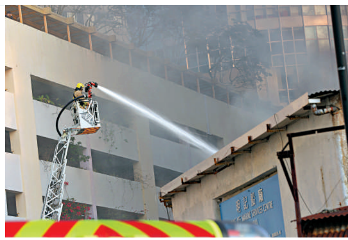
▲消防處出動二百二十八名消防及救護人員救援。