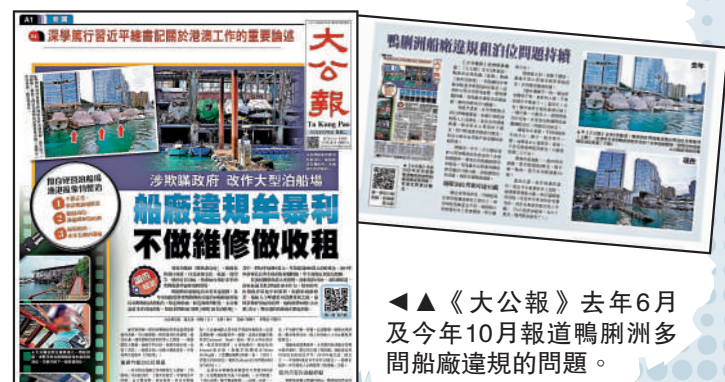
▲《大公報》去年6月及今年10月報道鴨洲多間船廠違規的問題。

在今年10月，記者再次到同一現場直擊，發現問題仍然持續，有船廠岸邊停泊多艘遊艇，從鴨洲海旁道的十多家船廠觀察到仍有船廠提供泊位租賃，有船廠以搭建的鐵排停泊着近10架小艇；而船廠對出的海面，則停泊着幾艘遊艇。有做租賃交易的船廠起碼有三間以上，停泊的船隻數量也不同，規模較小的就會在岸上搭建鐵排，將小艇掛上去；規模較大的，則除了鐵排，還會在海上搭建浮板來供船停泊，多的能泊超過四艘，小艇月租約3000元，水上電單車低至1000多元，遊艇則高達10萬元。大公報記者 古倬動