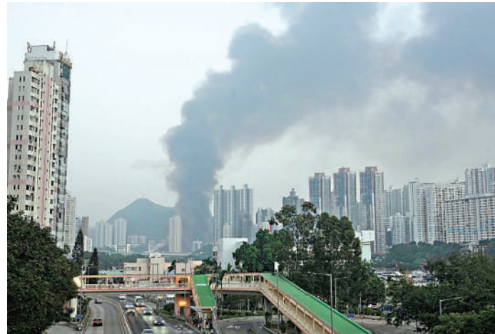
▲大火發生後，遠至田灣亦可見到滾滾濃煙。