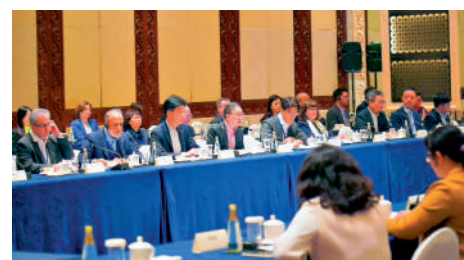
▲律政司司長林定國率領約30名香港涉外法律人才代表團6日前往深圳，展開粵港澳大灣區訪問行程。

林定國向媒體總結本次行程時表示，本次到訪的代表團成員非常有特色，除了有2個專業團體的領導，還有不同執業範圍的律師。他們背後所代表的律師行不是歷史悠久，就是在國際上非常知名，業務範圍涉及不同國際業務，如國際訂購、商事爭議解決、仲裁等，是各個領域的精英和國際化人才。「值得一提的是，有三分之一的成員是外籍、非華語律師，可以凸顯香港的國際化水平。並且當中超過8成，在內地已經有聯營所或者辦公的地點。」林定國繼續指，代表團此行的另外一個目的，是增進業界對內地發展的認識、思考如何用好香港的普通法制度，發揮香港優勢，融入國家發展大局。目前，香港正致力於利用中英雙語