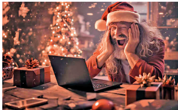
美國已進入傳統聖誕購物季，不少民眾趕在加關稅前，提前購買來自中國的商品。

2019年5月，美國貿易代表萊特希澤宣稱特朗普擬將對從中國進口的3000億美元商品加徵關稅，2019年8月特朗普