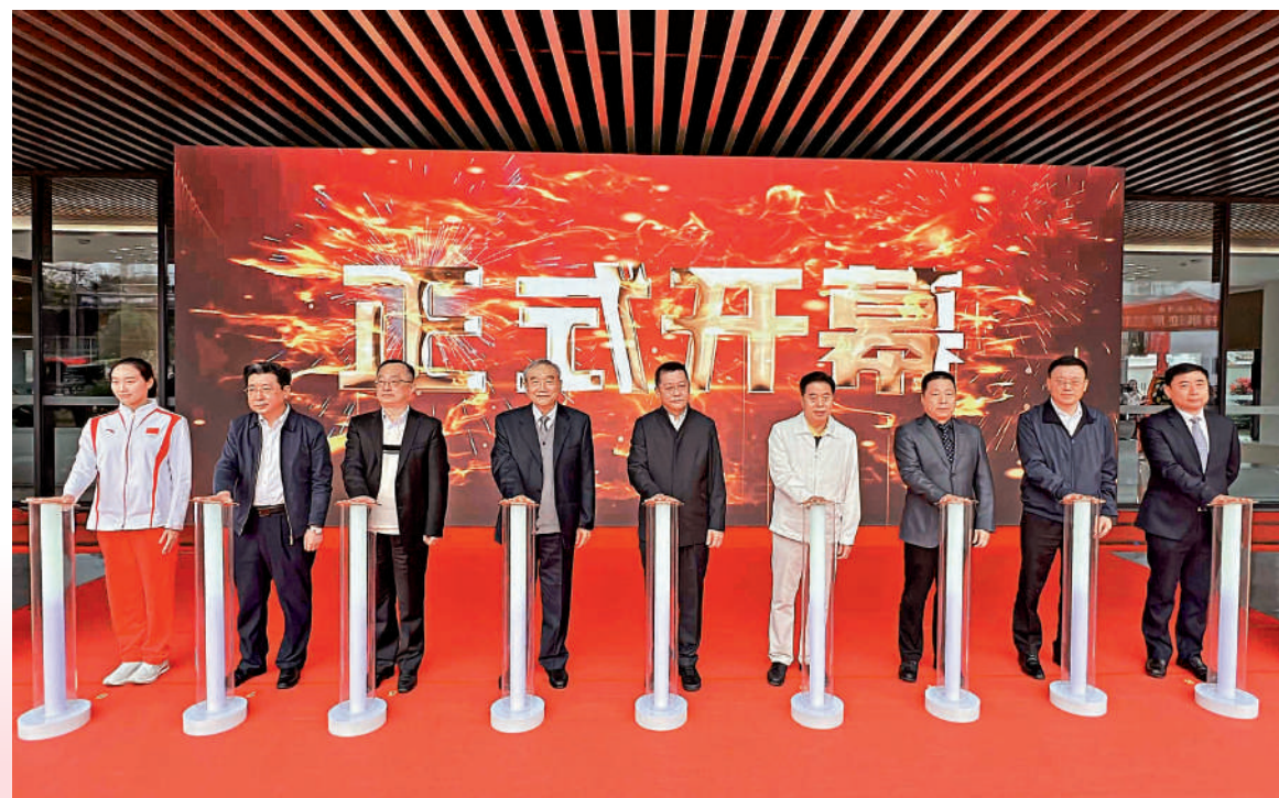
▲12月7日，位於廣東梅州的曾憲梓事跡展覽館正式對外開放。圖為開幕啟動儀式。