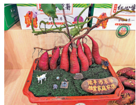
▲深圳食博會上展出的特色紅薯盆栽。

在陸豐展區，不少參觀者聚集在一盆盆外形奇異的盆栽周圍，「紅薯也能種成盆栽啊？太太太特別了，這怎麼做的，還能吃嗎？」現場的參觀者紛紛好奇拍照記錄。工作人員介紹，紅薯盆栽種植容易，不僅具有觀賞價值，其嫩葉還可以作為蔬菜食用，且富含營養。