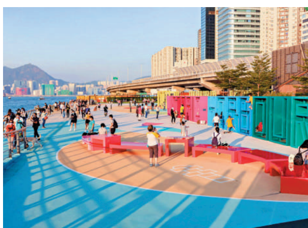
發展局表示，希望《2024年保護海港（修訂）條例草案》獲得通過，為海濱發展適度地「拆牆鬆綁」。

【大公報訊】記者卓彤報道：發展局和海濱事務委員會近年以「先駁通，再優化」策略駁通維港兩岸海濱長廊，盡早開放更多海濱用地給市民和遊客享用。發展局局長甯漢豪昨日在網誌提及，海濱長廊預計於今年年底延長至29公里，並期望於2028年進一步延長至34公里。