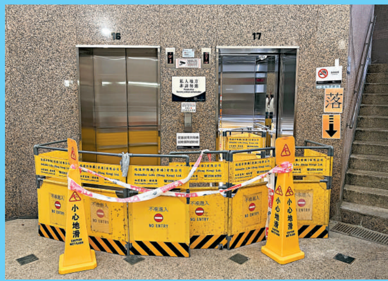
本港熟練升降機技術人員短缺情況嚴重，導致維修時間變長。