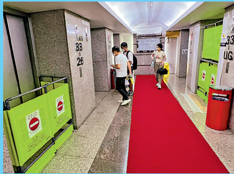
部分高齡工業大廈不時出現同時有升降機需要更換或維修情況，用戶上落相當不便。