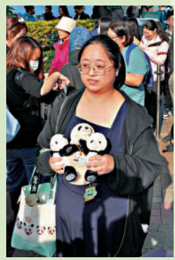
▲王小姐花了近400元購買毛絨公仔。