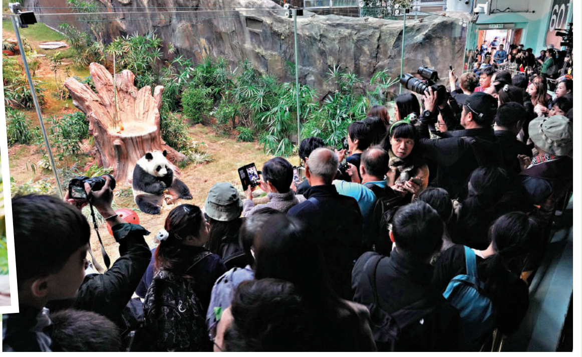
▲海洋公園四川奇珍館昨整天人頭湧湧，參觀大熊貓要持時間卡按時入場。

昨日海洋公園採用節數形式對入場人士進行分流，以先到先得方式在四川奇珍館外向觀眾派發「時間卡」，觀眾可按分配的時間進場。時間卡安排一小時有四節參觀，每節約有10分鐘參觀時間、約150人入場，場內亦有工作人員控制人流。海洋公園從昨日，每日安排數場直播，公眾可於網上觀賞「安安」、「可可」的動態。