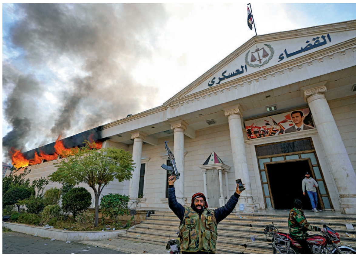
▲敘利亞反對派武裝人員8日在大馬士革一間軍事法庭縱火。