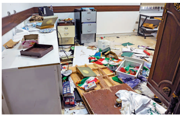
▲伊朗駐大馬士革使館8日遭到破壞和劫掠。

有分析認為，未來一段時間，敘利亞出現權力真空，局勢恐將進一步複雜化，美、俄、伊、土等外部勢力將展開新一輪博弈。中國外交部發言人表示，中方已積極協助有意願的中國公民安全有序離敘。