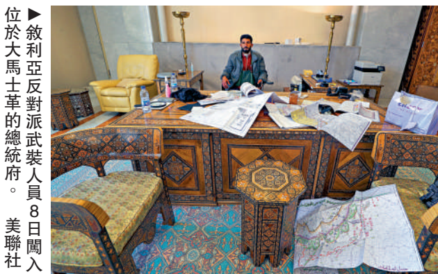
位於大馬士革的反對派武裝人員8日闖入敘利亞反對派武裝的總部。