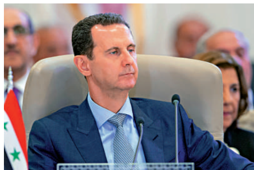
▲巴沙爾·阿薩德8日辭去敘利亞總統職務。資料圖片

亞「一團糟」，並強調美國不應該捲入這場戰鬥。美國總統國家安全事務助理沙利文7日稱，美國不會軍事介入，但擔憂敘利亞衝突可能產生外溢效應，將採取措施防止極端組織「伊斯蘭國」復甦。