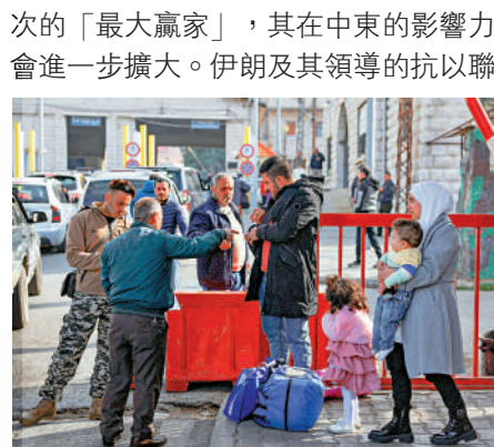
▲敘利亞民眾8日從黎巴嫩返回敘利亞。

【專家拆局】西北大學中東研究所副教授王晉表示，敘利亞政治結構勢必迎來重建，美俄都將重新觀察局勢發展，土耳其則堪稱此次的「最大贏家」，其在中東的影響力會進一步擴大。伊朗及其領導的抵抗之