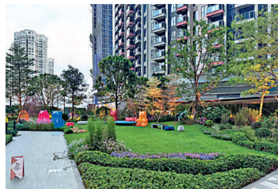
▲YOHO WEST最近陸續收樓入伙。

WEST上月開始收樓，暫錄逾30宗租賃成交，租盤供不應求，不少租客等候放盤。其中，該盤3B高層B3室一房戶，實用面積286方呎，零議價以1.25萬元租出，呎租43.7元創屋苑新高之外，更貴絕天水圍區。業主於2024年1月以423萬元一手買入，租金回報約3.6厘。