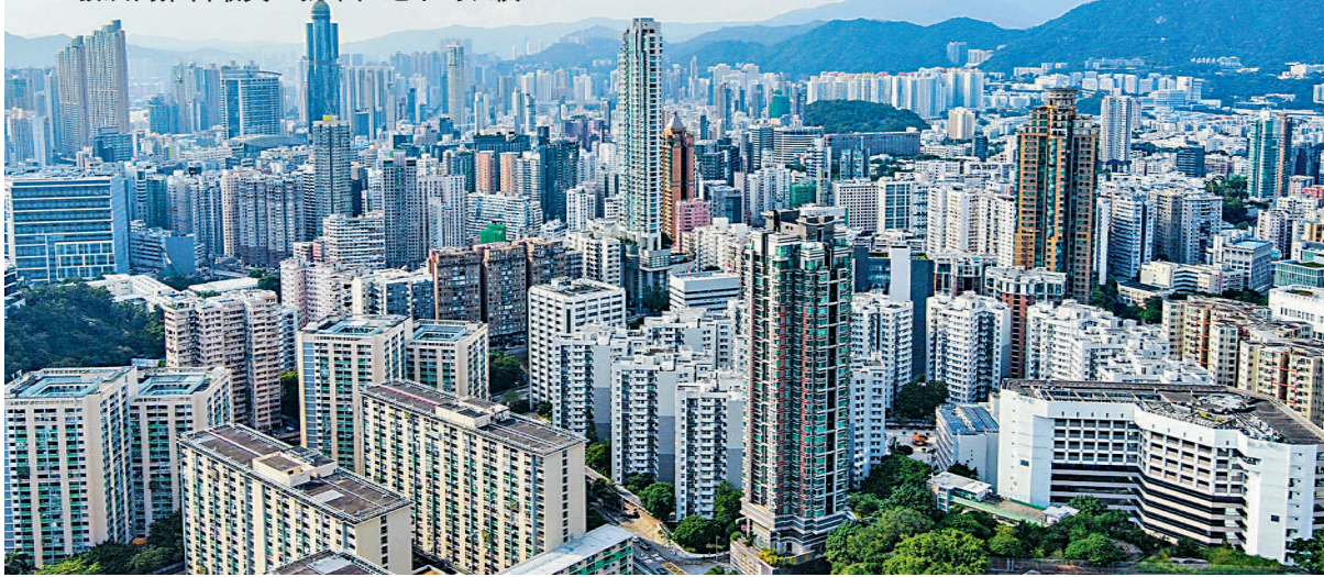
▲本港樓價持續調整，但租金不跌反升，令住宅單位回報率提升。