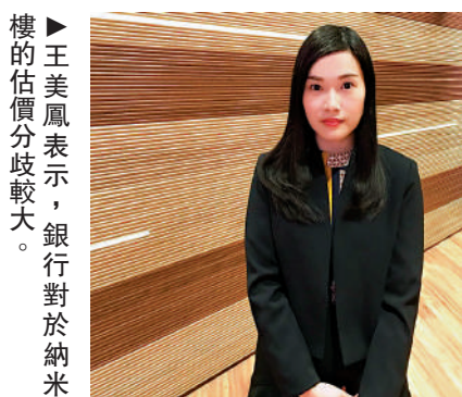
樓的估價分歧較大。