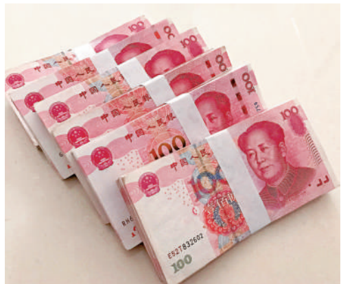
互聯互通產品的人民幣計價落地，有助人民幣國際化。

險管理工具。譚岳衡認為，香港具有諸多優勢，政治穩定、法制完善、透明度和國際化程度高等，從地緣和風險分散方面，都有積極作用。