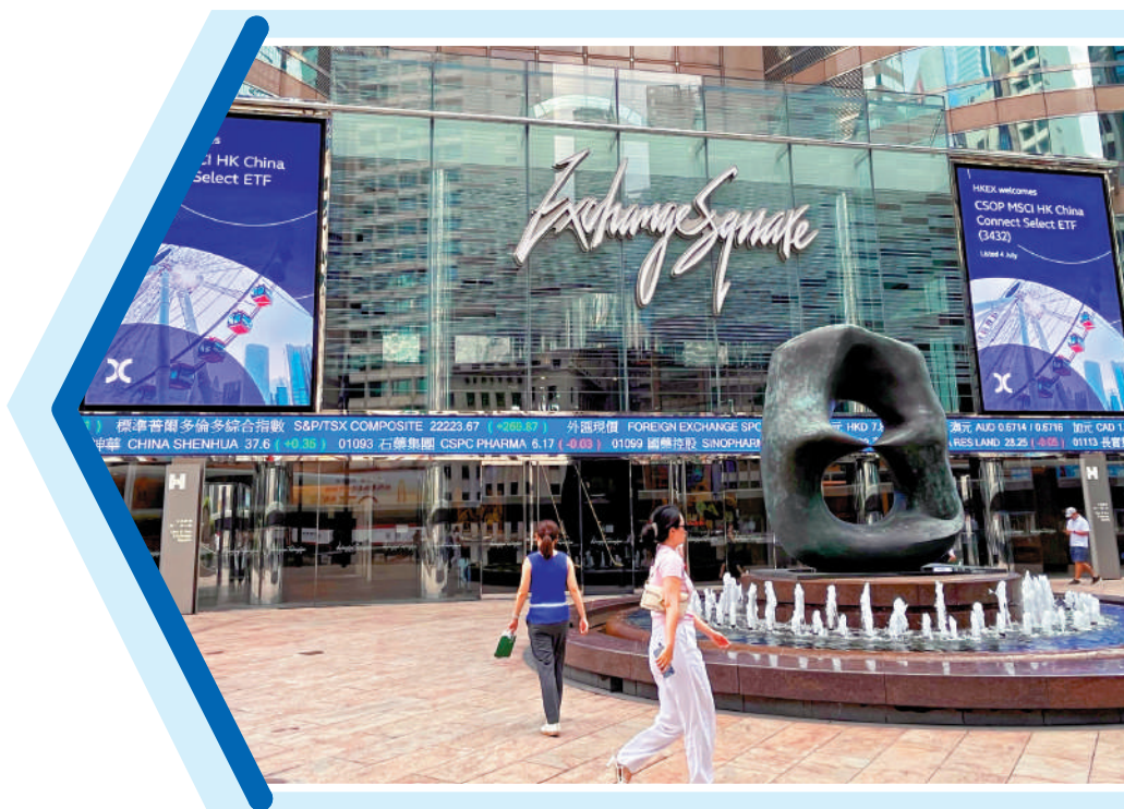
互聯互通機制開通十年，持續穩步有序推進，為國家金融市場擴大開放、建設金融強國注入新活力。