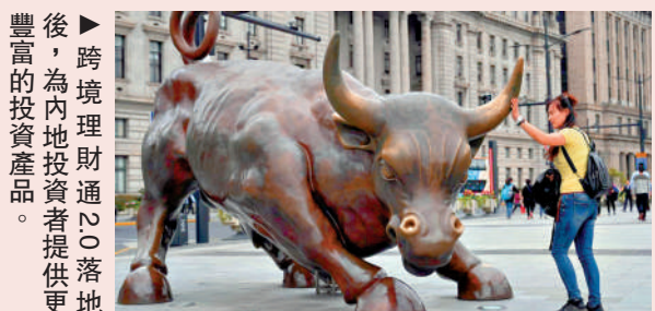
後，為內地投資者提供更多豐富的投資產品。

展至證券公司。首批共有14家證券公司獲批開展業務。國泰君安國際表示，合資格投資者在國泰君安證券及國君國際開立賬戶後，可進行外幣兌換、資金轉賬、產品投資等，體驗「一站式」跨境投資服務，未來可借助國際化投資優勢，與總公司國泰君安證券，為大灣區投資者提供跨境理財產品和服務，滿足全球资产配置的需求，促進內地與港澳金融市場互聯互通。