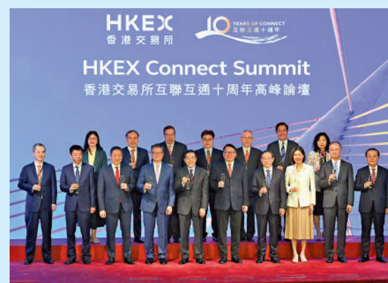
互聯互通機制開通十年，大大提升中國市場的深度，成績是有目共睹。