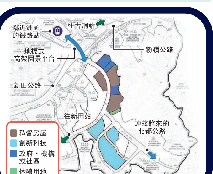
新田科技城片區試點