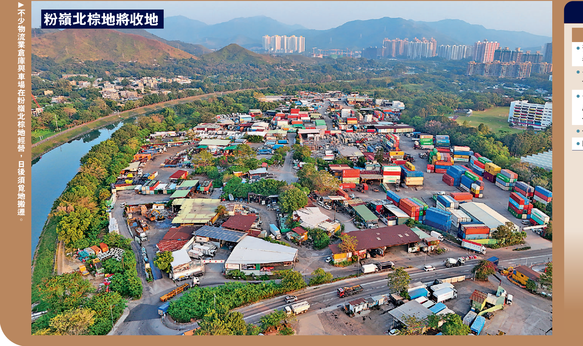
粉嶺北棕地將收地