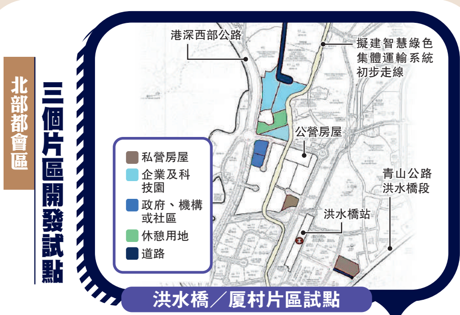
洪水橋／厦村片區試點