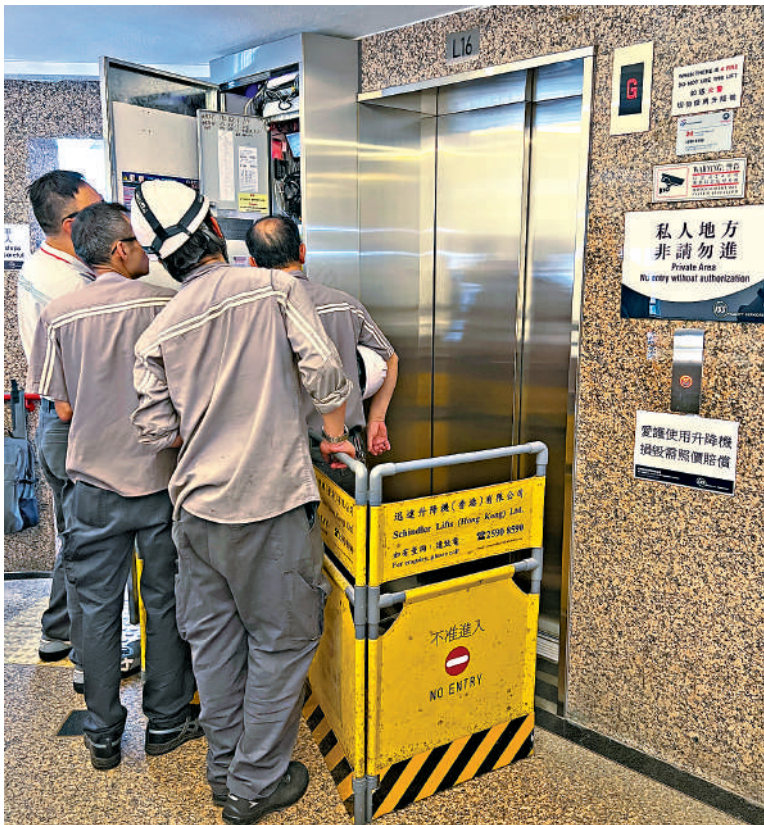
康景花園的升降機去年9月因颱風「蘇拉」導致水浸，需要更換新機，逾一年時間到今年10月才完成工程。

升降機。對於香港升降機維修的時間普遍較長，他認為有多個原因，如果大廈的升降機壞了，或者馬達用得太久而損耗，甚或電纜出現磨損，維修時間可能要久一點；而最麻煩的是老舊大廈的升降機經常遇到零件停產問題。