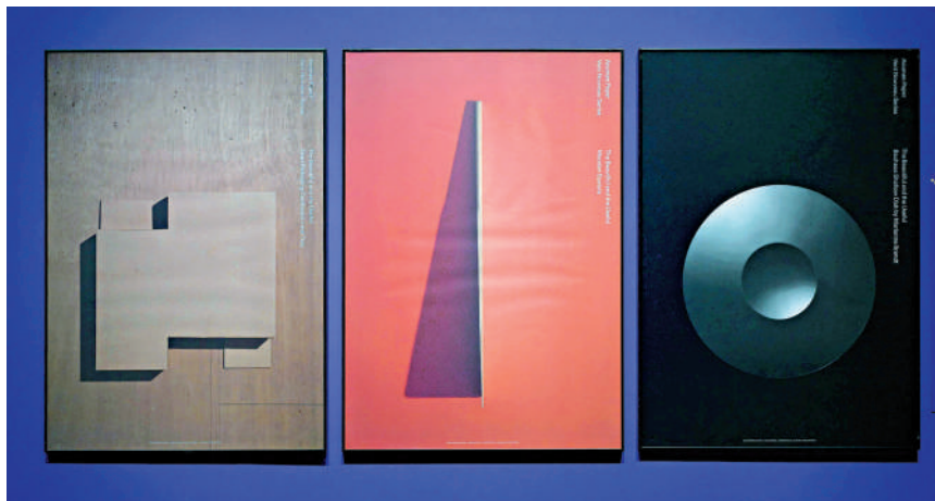
「商業與廣告」組別金獎作品《實用之美》。