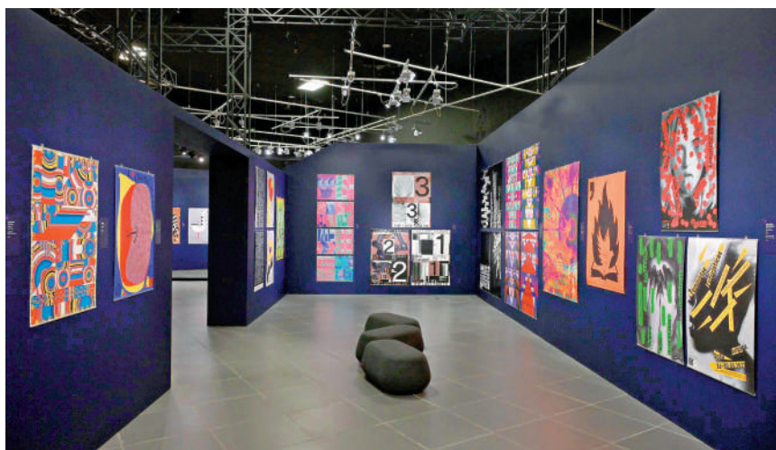
「無域——香港國際海報三年展2024」展場一隅。