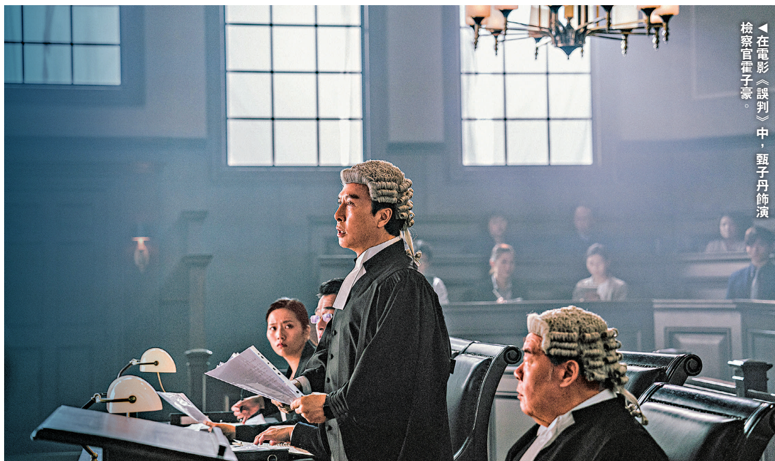
在電影《誤判》中，甄子丹飾演檢察官霍子豪。

最近香港電影市道復甦，今年的《九龍城寨之圍城》、《破·地獄》、《焚城》均叫好叫座。在2024年完結前，甄子丹自導自演兼監製的新片《誤判》將於12月21日接力上映，望能為港產片保持勢頭。早前甄子丹接受專訪，暢談這部電影的籌備及拍攝過程。子丹坦言最初老闆黃百鳴找他拍這部戲時，他是推卻的，「都是法庭的題材，子華之前拍的《毒舌大狀》拍得這麼好，我不想好像抄人家。」但後來黃百鳴再相約他傾劇本，指戲中檢察官霍子豪一角人選就是他，他便再做了些資料搜集，找法律顧問研究，希望可以用的角度去拍攝。他說：「但我跟老闆說，戲中所有演員都是我指定的。」結果便達成了今次合作。