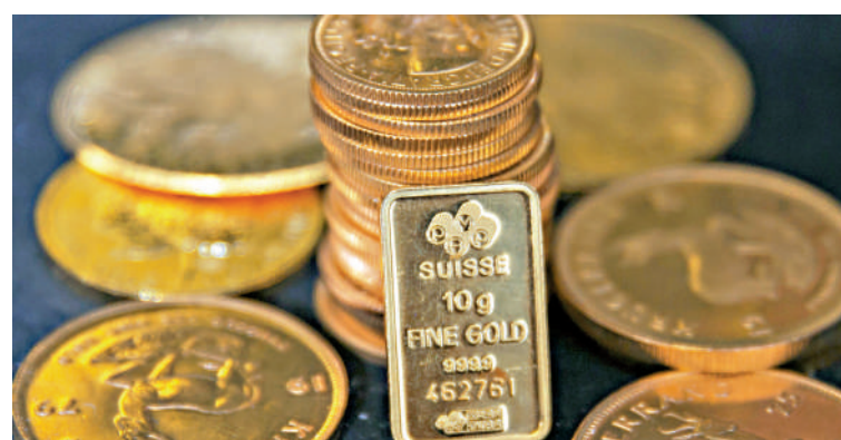
▲黃金今年表現強勁，年初至今累積大漲三成。

加拿大央行在聲明中暗示，經過一輪急速的減息行動後，明年減息的步伐或幅度將會放慢。減息後，加元兌美元不跌反升，曾報1.4127加元，升近0.3%。