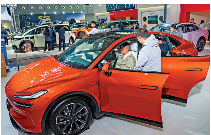
▲中國今年全年汽車產銷料保持在3000萬輛以上。

中汽協指出，中央政治局在本月9日召開會議分析明年經濟工作。明年政策環境依舊暖，有利於汽車行業保持健康發展，中汽協呼籲相關促銷汽車消費政策明年繼續延續，並及早出台。