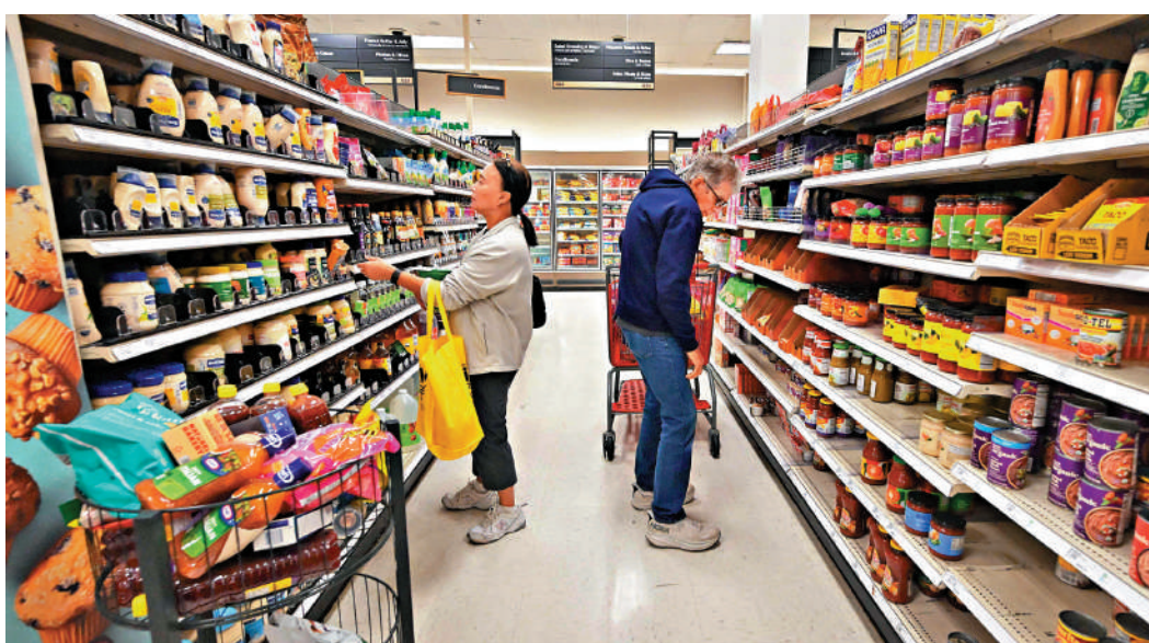
▲美國11月消費物價指數按年升2.7%，升幅較10月擴大。