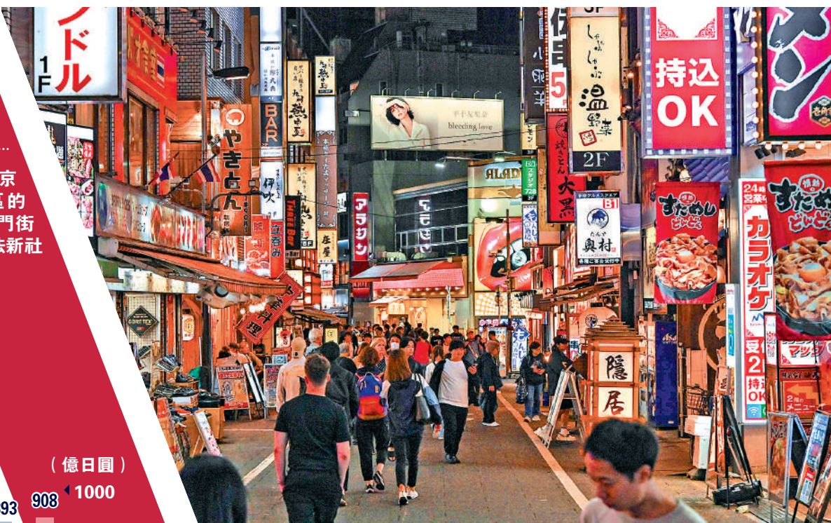
▶日本東京市新宿區的一條熱門街道。