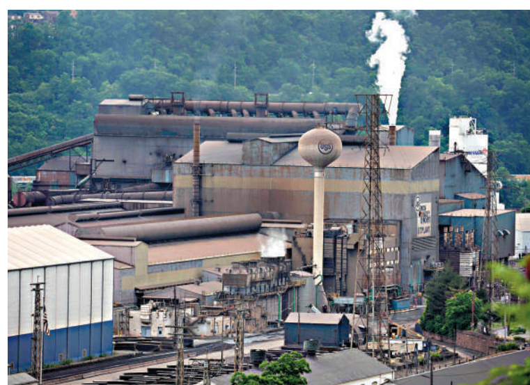
◀位於賓夕法尼亞的美國鋼鐵公司工廠。

11月，柒和伊控股在東京證券交易所暫停交易。據報道，其創始人「伊藤家族」不願便利店被外企收購，聯手日本的銀行等，計劃籌集超過8萬億日圓，將柒和伊控股私有化。這一舉措被業界認為是針對加拿大公司的7-Eleven「收購保衛戰」。