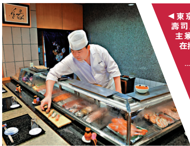
◀東京一家壽司店的店主主廚正在擺盤。

日本東京商工調查所12月9日發布最新一份「全國企業破產」報告。調查數據顯示，日本餐飲業正經歷10年來最大倒閉潮。從今年1月至11月，日本餐飲店倒閉數量已達到908家，較去年同期增長11.0%，比2023年全年倒閉數量還多出15家。分析指，雖然疫情後日本旅遊業強勁復甦，但受通脹高企、物價上漲、勞動力短缺等諸多社會因素影響，餐飲業大蕭條不可避免。