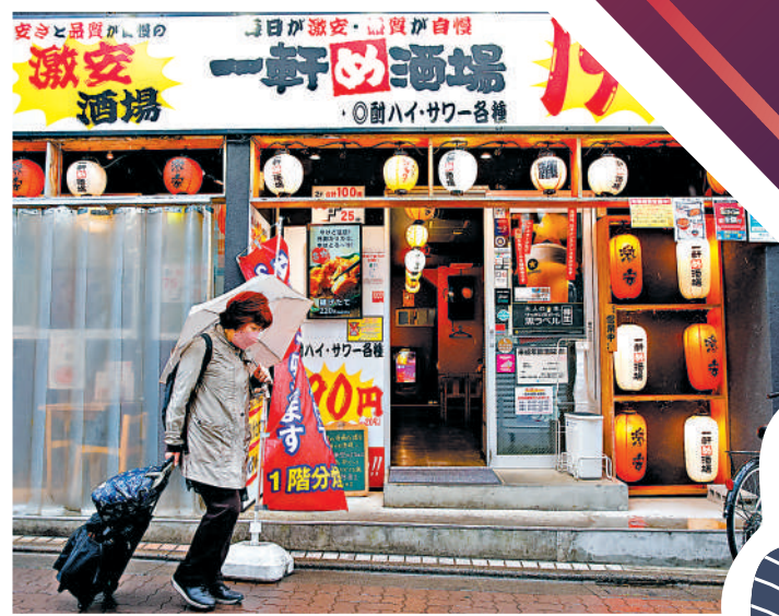
▲一名婦女路過東京一家居酒屋。

於歷史性疲軟狀態、消費乏力等因素影響，預計2024年企業破產數量將繼續增加並突破一萬宗（2023年為8690宗），而小企業佔多數的日本「百年老店」今後或將面臨更加嚴峻的局面。（綜合報道）