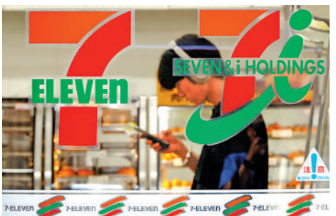
▲日本便利店7-Eleven的日本母公司柒和伊控股陷入收購保衛戰。

【大公報訊】據紐約時報、中社社報道：日本經歷十年來最大的餐廳倒閉潮，居酒屋首當其衝；而另一個被視作日本特色的便利店也流年不利。便利店Circle K的加拿大母公司Alimentation