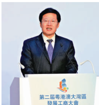
▲高雲龍表示，中央政府繼續支持香港和澳門更好地融入國家發展大格局。

全國政協副主席、全國工商聯主席高雲龍致辭時表示，中央政府繼續支持香港和澳門更好地融入國家發展大格局，推動粵港澳大灣區建設，成為新發展格局的戰略支點、高品質發展的示範地以及中國式現代化的引領地。