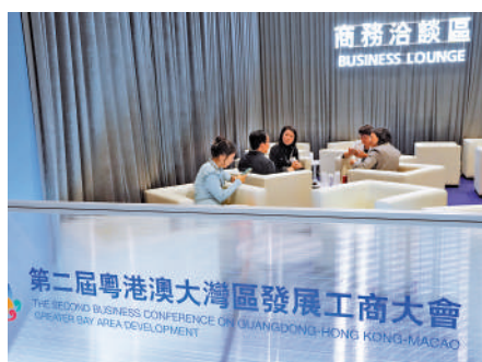
▲大會設商務洽談區，便利出席的商界代表商談合作。