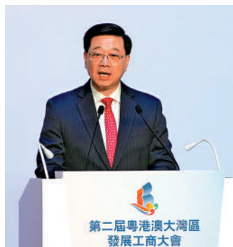
▲李家超表示，香港與大灣區各城市優勢互補。

行政長官李家超致辭表示，香港是大灣區的中心城市之一，有「一國兩制」的獨特優勢，與大灣區各城市優勢互補，持續優化各項互聯互通措施，是大灣區建設的積極參與者、推動者、得益者。特區政府10月發表的2024施政報告推出了多項關於推動大灣區建設的措施，包括推動河套港深創科園發展，以及在物流、航空、專業資格、資金、數據、流通、法律等多個領域加強互聯互通規則銜接，機制對接。這次大會以「中國灣區，世界機遇」為主題，點明大灣區建設的願景，更展示大灣區為全球投資者帶來的商機。