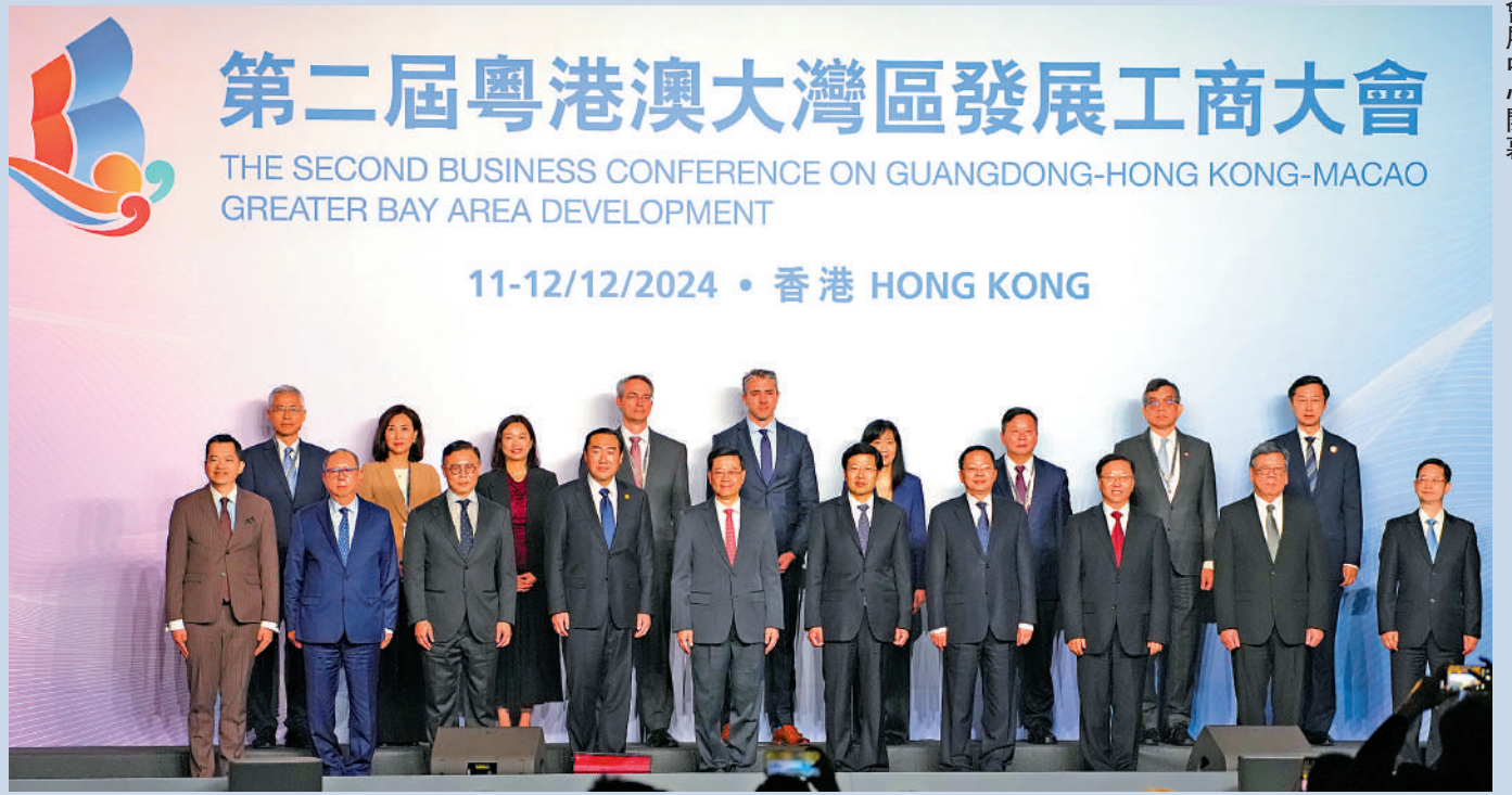
中國國際貿易促進委員會、廣東省人民政府、香港特別行政區政府共同主辦的第二屆粵港澳大灣區發展工商大會，昨日在香港會展中心開幕。