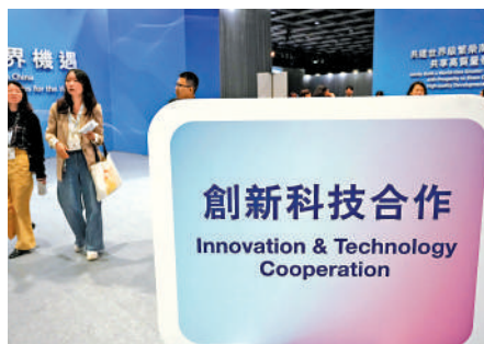
▲創新科技合作是大會深入探討的主題之一。