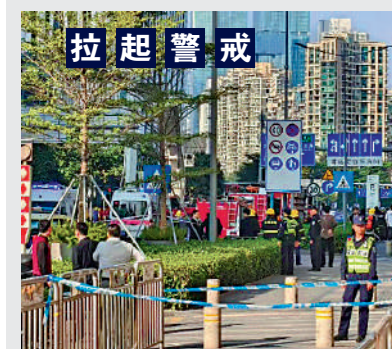
▲爆炸後，涉事樓棟外圍已拉上警戒線，禁止行人及車輛通行。