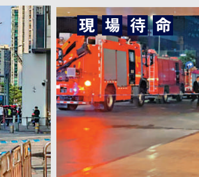
▲入夜後深圳灣萬象城現場仍有消防車待命。