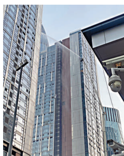
▲消防車正在向起火單位噴水滅火。

若門鎖溫度很高或開門有濃煙，應退守待援。用打濕的衣物、床單等堵住門縫，潑水降溫防煙。在選擇躲避位置時，要盡量選擇建築物外側靠近主要街道並且有可開啟外窗的房間，要盡快撥打火警電話，提供盡量清晰具體的信息，可在窗邊發出聲響或燈光、揮舞衣物求援。