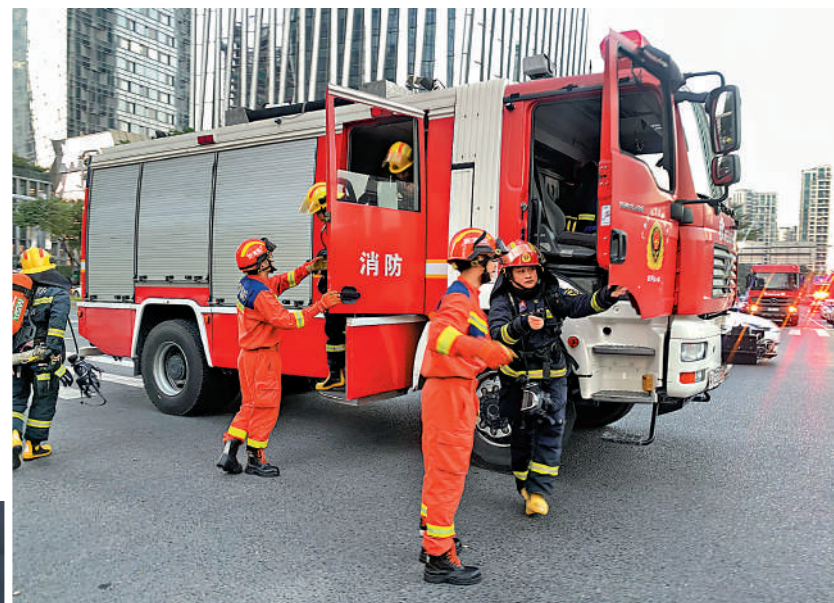
▲大批消防救護人員趕赴現場救援。