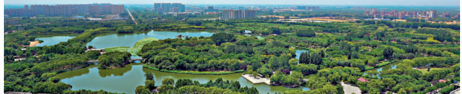
▲近年來，北京大興區逐漸成為首都的「新國門」。