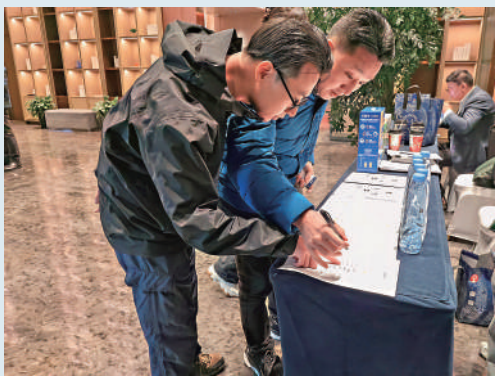
▲海外華文媒體高層在簽到台報到。