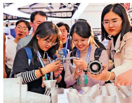
▲11月27日，在鏈博會先進製造鏈展區，參觀者觀看激光3D打印金屬製品。

【大公報訊】據新華社報道：中央經濟工作會議確定，明年要以科技創新引領新質生產力發展，建設現代化產業體系。加強基礎研究和關鍵核心技術攻關，超前布局重大科技項目，開展新技術新產品新場景大規模應用示範行動。開展「人工智能+」行動，培育未來產業。