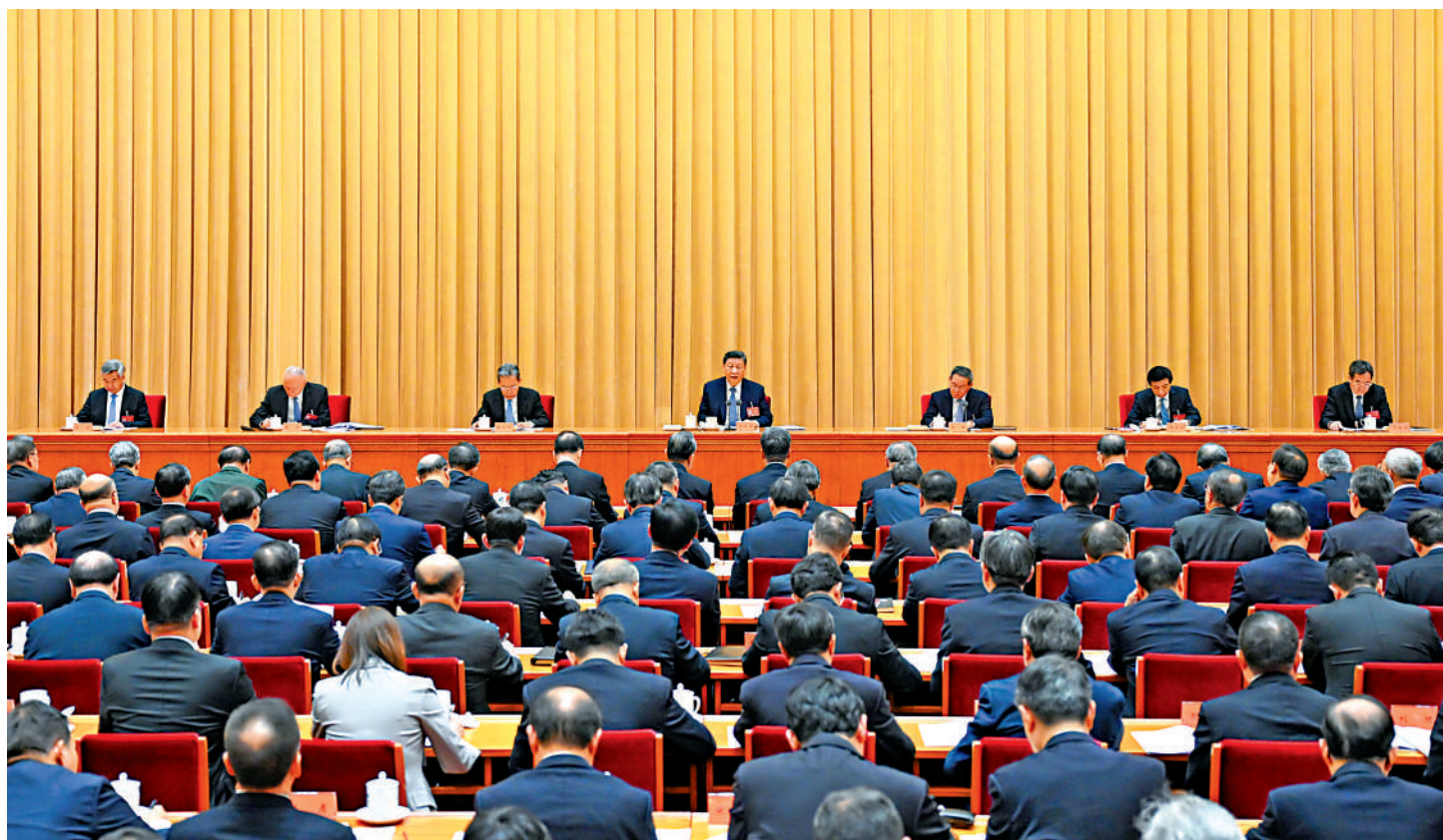
▲12月11日至12日，中央經濟工作會議在北京舉行。中共中央總書記、國家主席、中央軍委主席習近平出席會議並發表重要講話。李強、趙樂際、王滬寧、蔡奇、丁薛祥、李希出席會議。