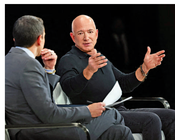
▲貝佐斯（右）近期嘗試修復與特朗普的關係。

Meta創辦人朱克伯格與特朗普的關係也經歷了類似的轉變。Facebook曾在2021年1月6日美國國會暴亂事件後「封殺」特朗普，特朗普則威脅要讓朱克伯格坐牢。今年夏季開始，朱克伯格頻繁向特朗普示好，並於上月底前往海湖莊園拜訪特朗普。