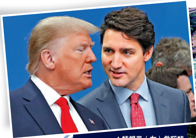
▲特朗普（左）戲稱特魯多為「加拿大州州長」。

美國候任總統特朗普威脅對加拿大商品徵收25%的關稅，引發加方強烈不滿。加拿大安大略省省長福特12日說，該省考慮把限制對美電力供應作為「終極手段」，預計將影響美國150萬戶家庭。知情人士透露，加拿大政府可能對出口美國的原油、鉀肥和鈾等商品徵收出口稅，作為對特朗普關稅政策的反擊。美媒指出，美加關稅戰將導致雙方兩敗俱傷，加拿大經濟將遭受嚴重打擊，美國也將陷入新一輪通脹危機。