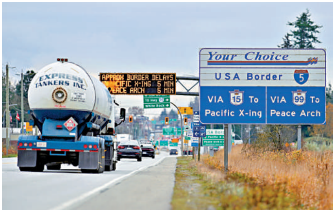
▲11月26日，貨車從加拿大邊境駛向美國。

加拿大是美國最大的原油供應國，美國中西部地區的煉油廠尤為依賴便宜的加拿大重質原油。加拿大為美國核電站提供大量鈾，亦是美國農場肥料的重要來源。美媒指出，美加關稅戰將推高美國國內的能源和汽車等商品價格。美國財長耶倫日前警告說，特朗普的關稅政策不利於抑制通脹。（綜合報道）