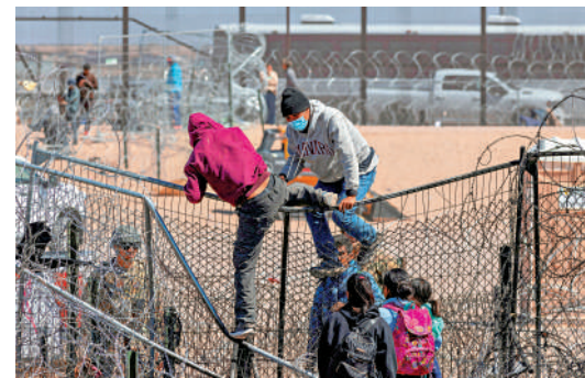
▲今年3月，非法移民試圖翻越美墨邊境的

美媒13日爆料稱，即將卸任的拜登政府正在悄悄拍賣建造美墨邊境牆所用的材料，一塊鋼材的起拍價僅為5美元。共和黨人批評拜登政府破壞特朗普保衛邊境的計劃。