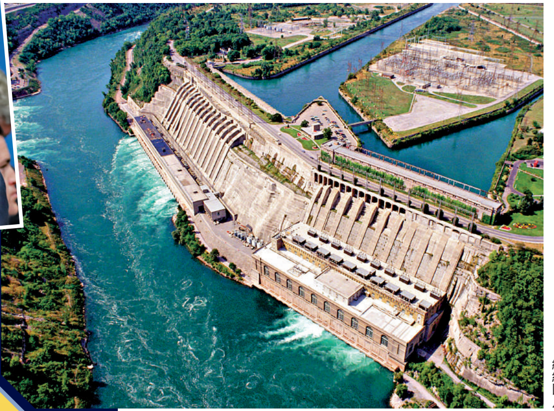
▲加拿大安大略省威爾遜限制對美供電。圖為安大略省的水力發電設施。

【大公報訊】加拿大總理特魯多11日與各省和地區官員舉行會議，討論如何應對特朗普關稅威脅。據加媒報道，福特在會後表示，安大略省正在編製一份報復措施清單，其中包括限制對美國的電力出口。福特12日與美國密歇根州州長通話時說，限制電力出口是「終極手段」。「我們向美國發出信息：如果你們來傷害安大略省，傷害安大略乃至加拿大民眾的生計，我們會使用工具箱中的每件工具保衛安大略人、保衛加拿大人。」