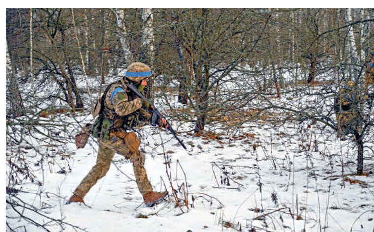
▲烏克蘭士兵12日在烏北部城市切爾尼夫接受訓練。

美國候任總統特朗普12日表示，他「強烈反對」拜登政府允許烏克蘭使用美國援助的導彈以及其他武器打擊俄羅斯縱深目標。「我們為什麼要這樣做？我們完全是在升級戰爭，並讓情況變得更糟……我認為這大錯特錯。」美國國家安全委員會戰略溝通協調員柯比同日表示，拜登當天批准向烏克蘭提供價值5億美元的額外軍援，包括防空武器、炮彈、無人機和裝甲車等。